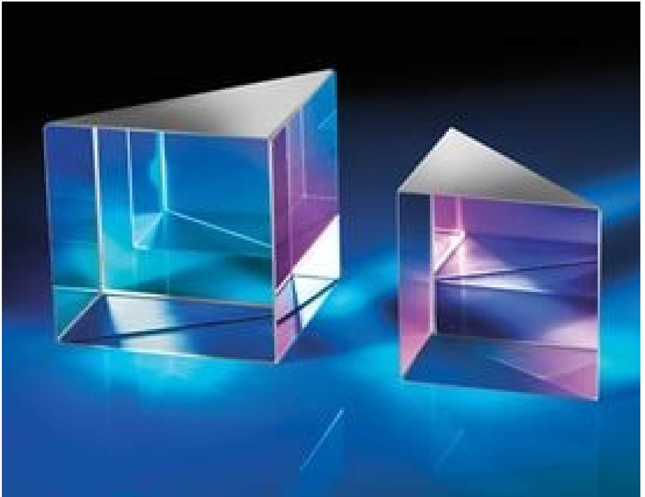
N-BK7 High Tolerance Right Angle Prisms