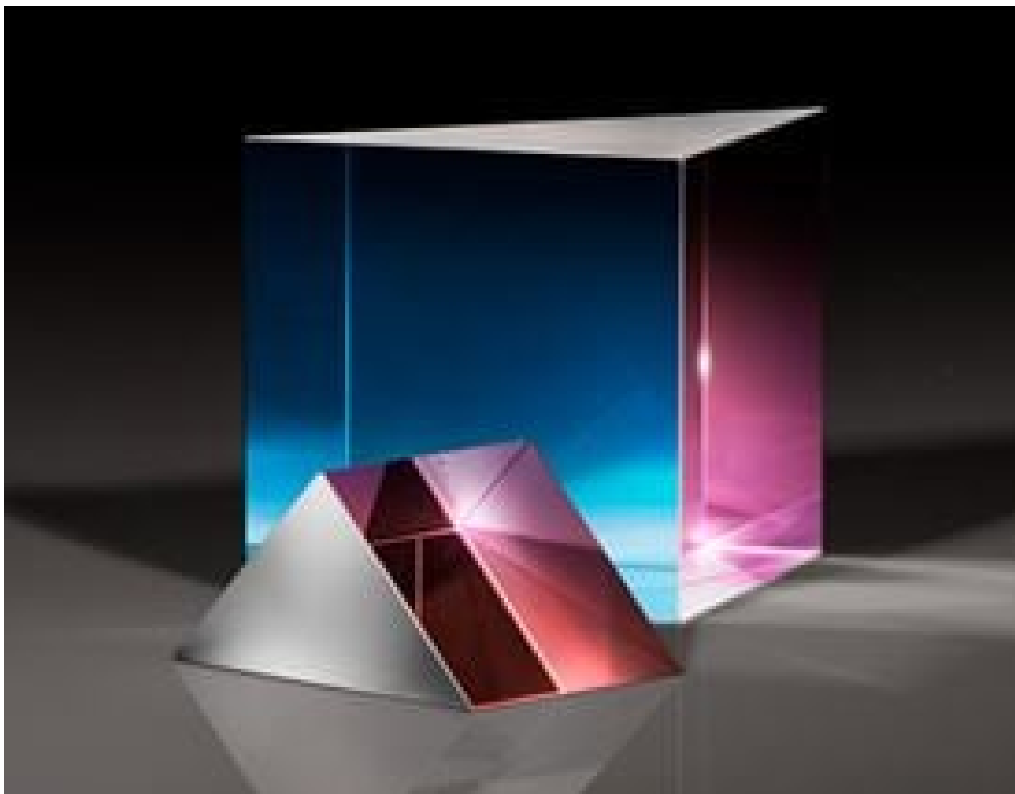
TECHSPEC High Tolerance UV Fused Silica Right Angle Prisms