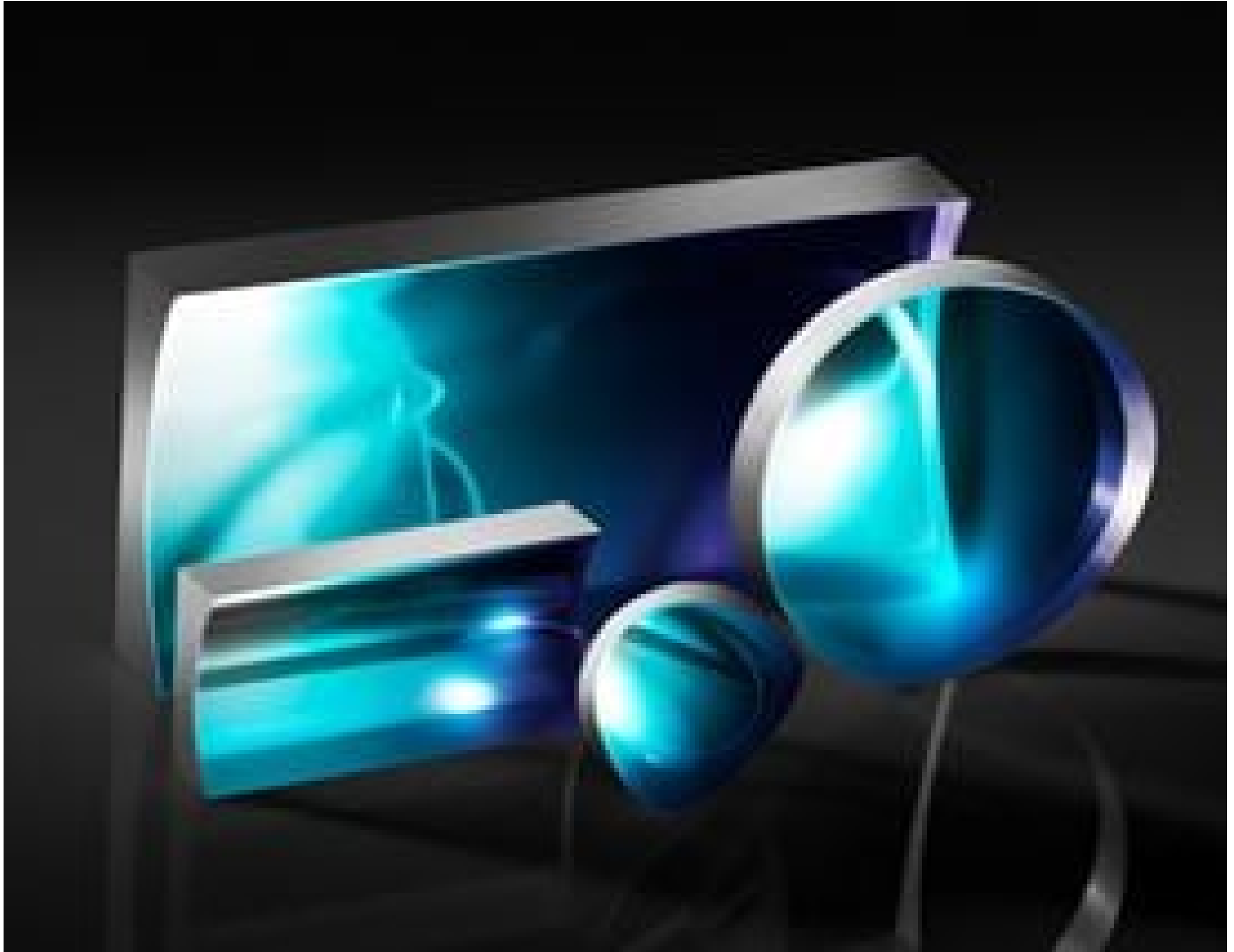
TECHSPEC® Illumination Grade PCV Cylinder Lenses