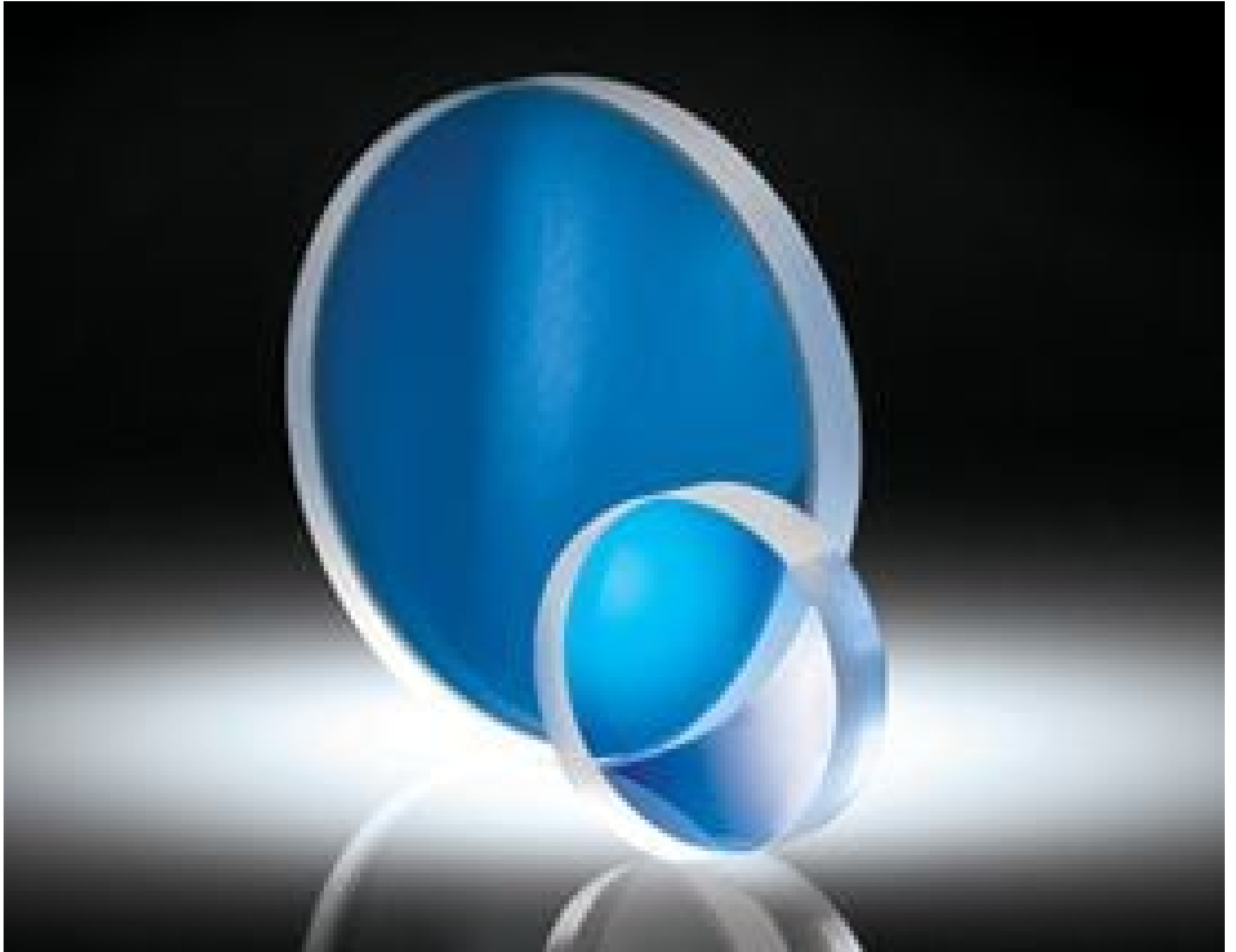
Spherical Aberration Compensation Plates