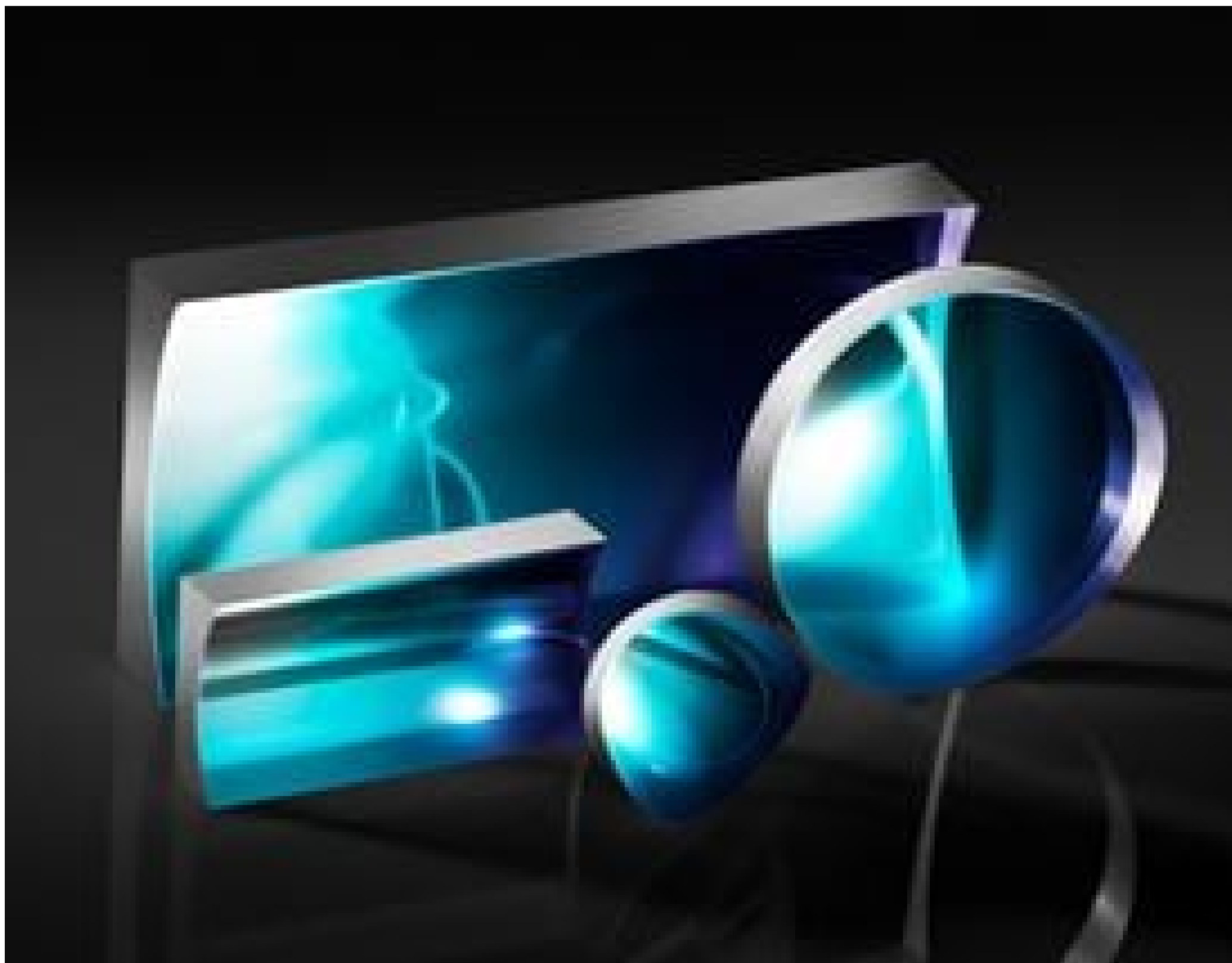
TECHSPEC® Illumination Grade PCV Cylinder Lenses