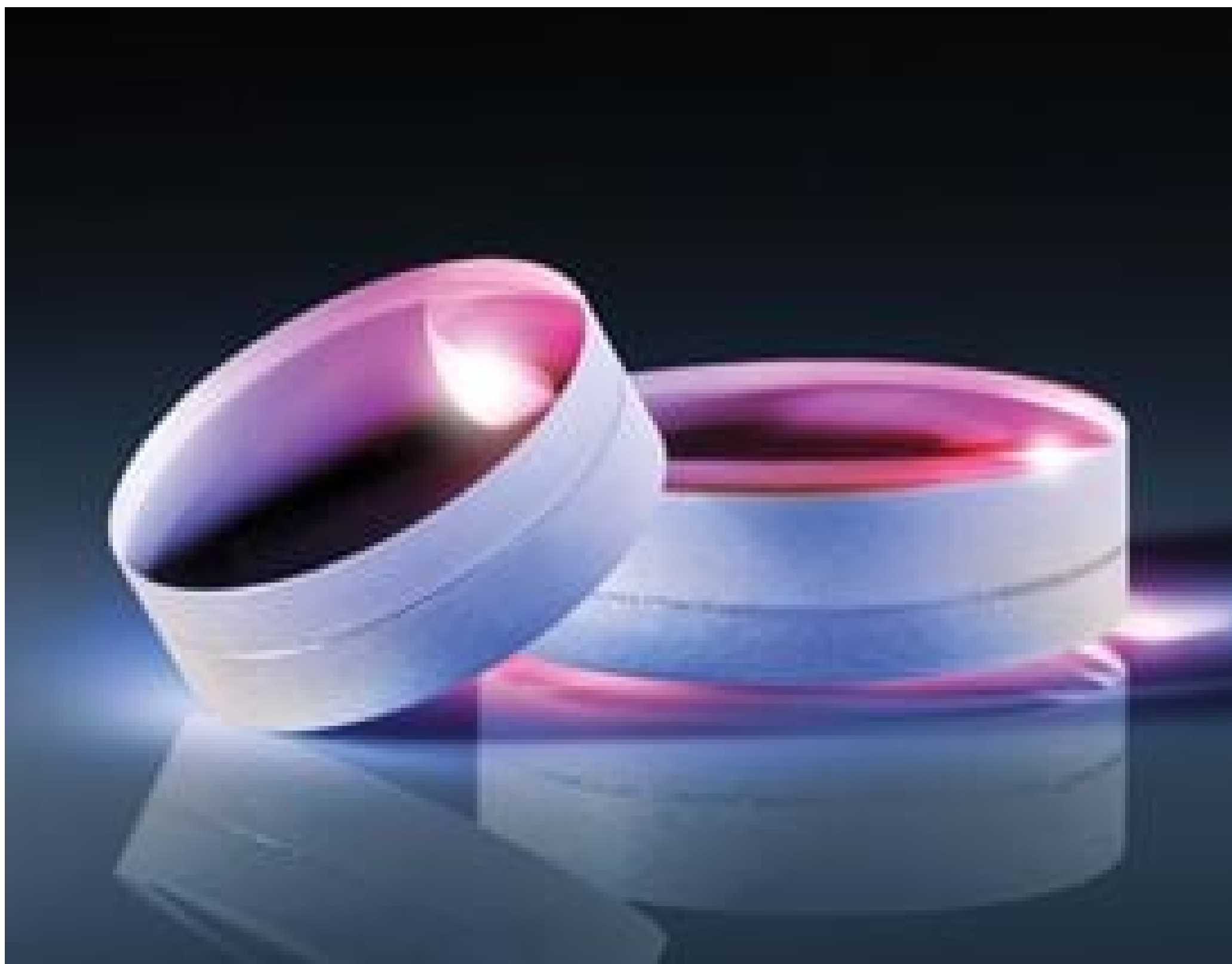
MgF 2 Coated Achromatic Lenses