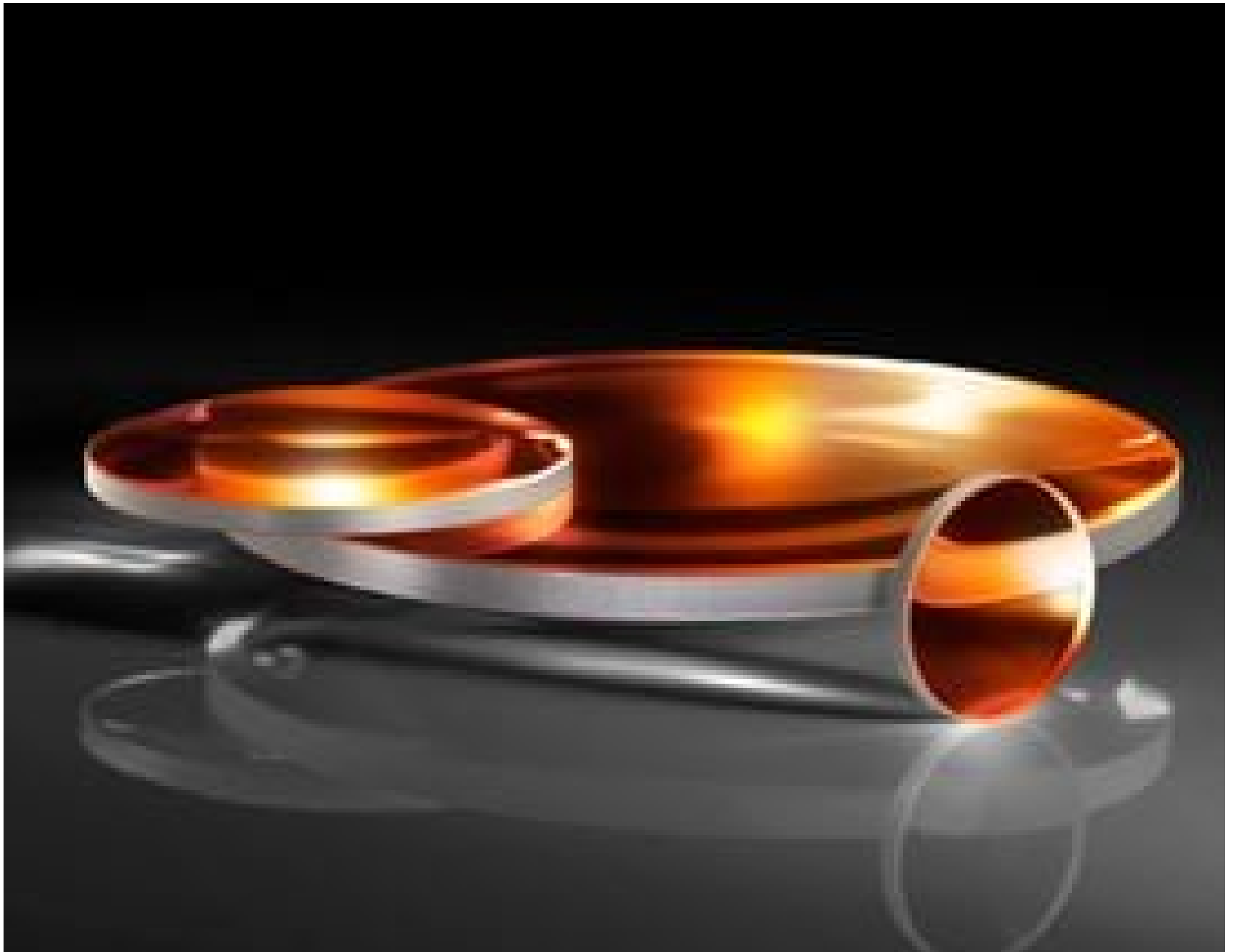
TECHSPEC Calcium Fluoride Plano-Convex (PCX) Lenses