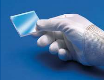
Outils de Manipulation de Composants

Ces optiques nécessitent une manipulation particulière afin d'éviter tout dommage et de garantir leur performance à long terme. Une manipulation, un nettoyage et un stockage appropriés sont essentiels pour préserver la qualité optique. Consultez nos Ressources de nettoyage des optiques pour obtenir des instructions étape par étape et découvrir les meilleures pratiques. Pour obtenir une assistance personnalisée, envoyez-nous un e-mail ou discutez avec notre équipe d'assistance technique.