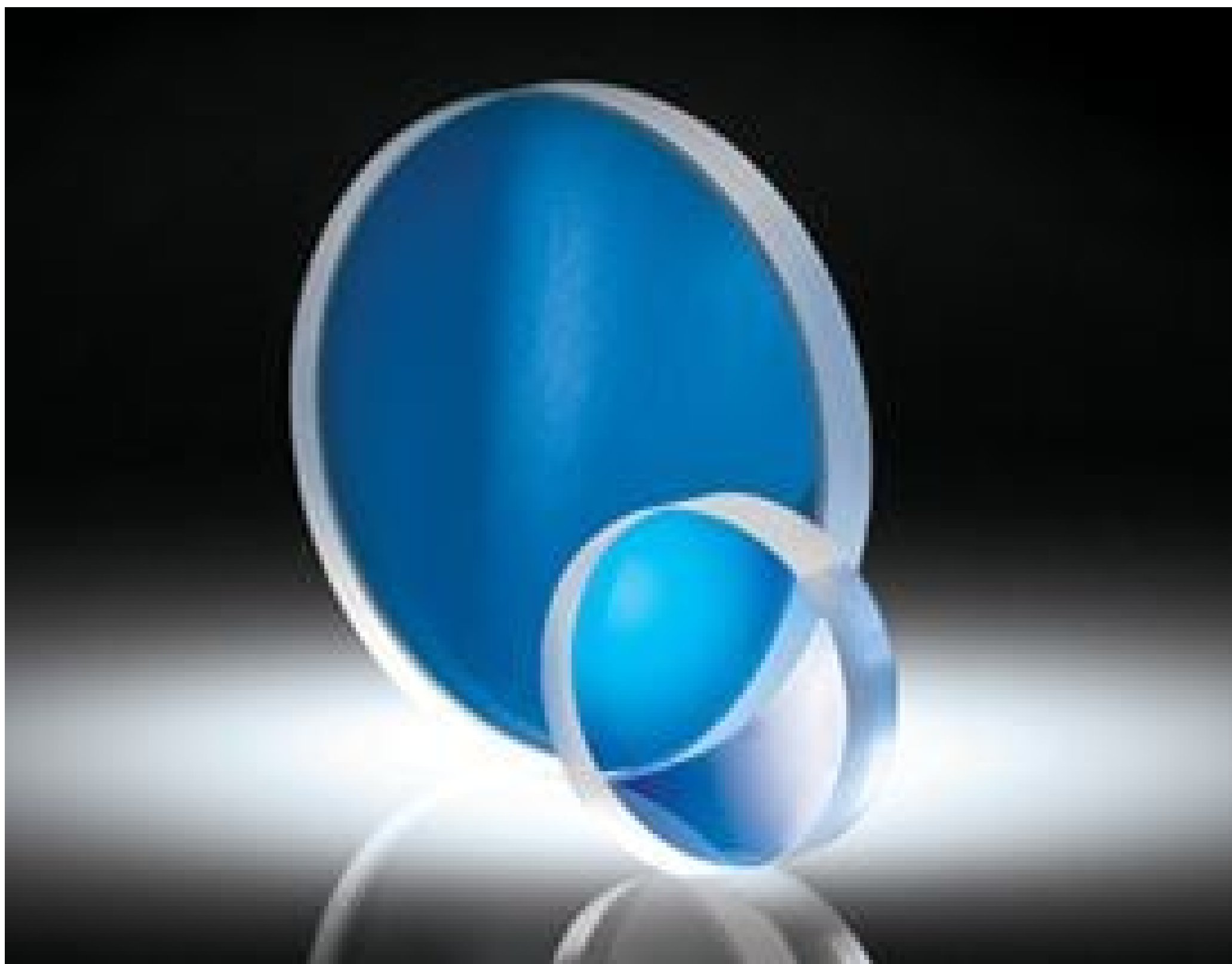
Spherical Aberration Compensation Plates