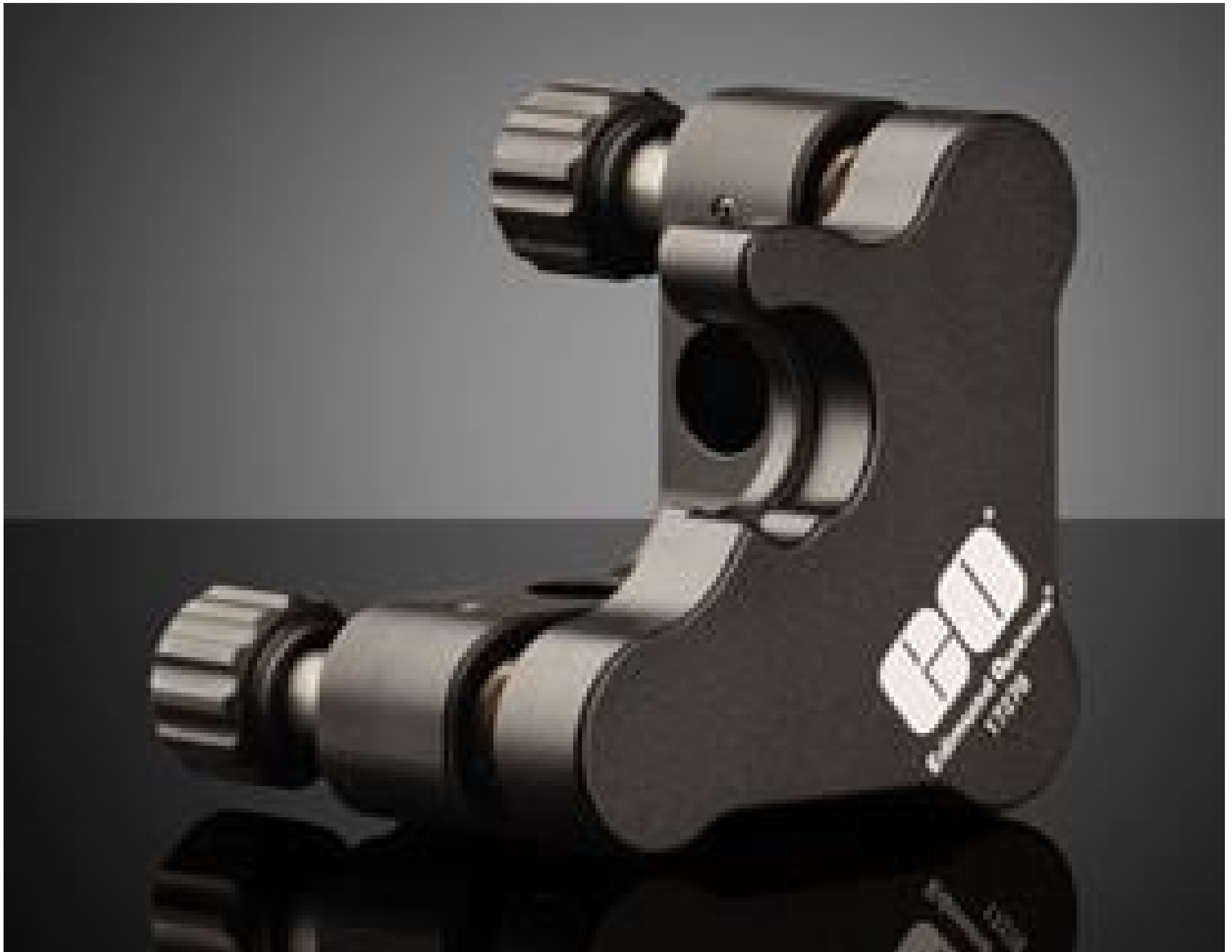
#17-278, 12.5/12.7mm Optic Dia., E-Series Clear Edge Kinematic Mbunt