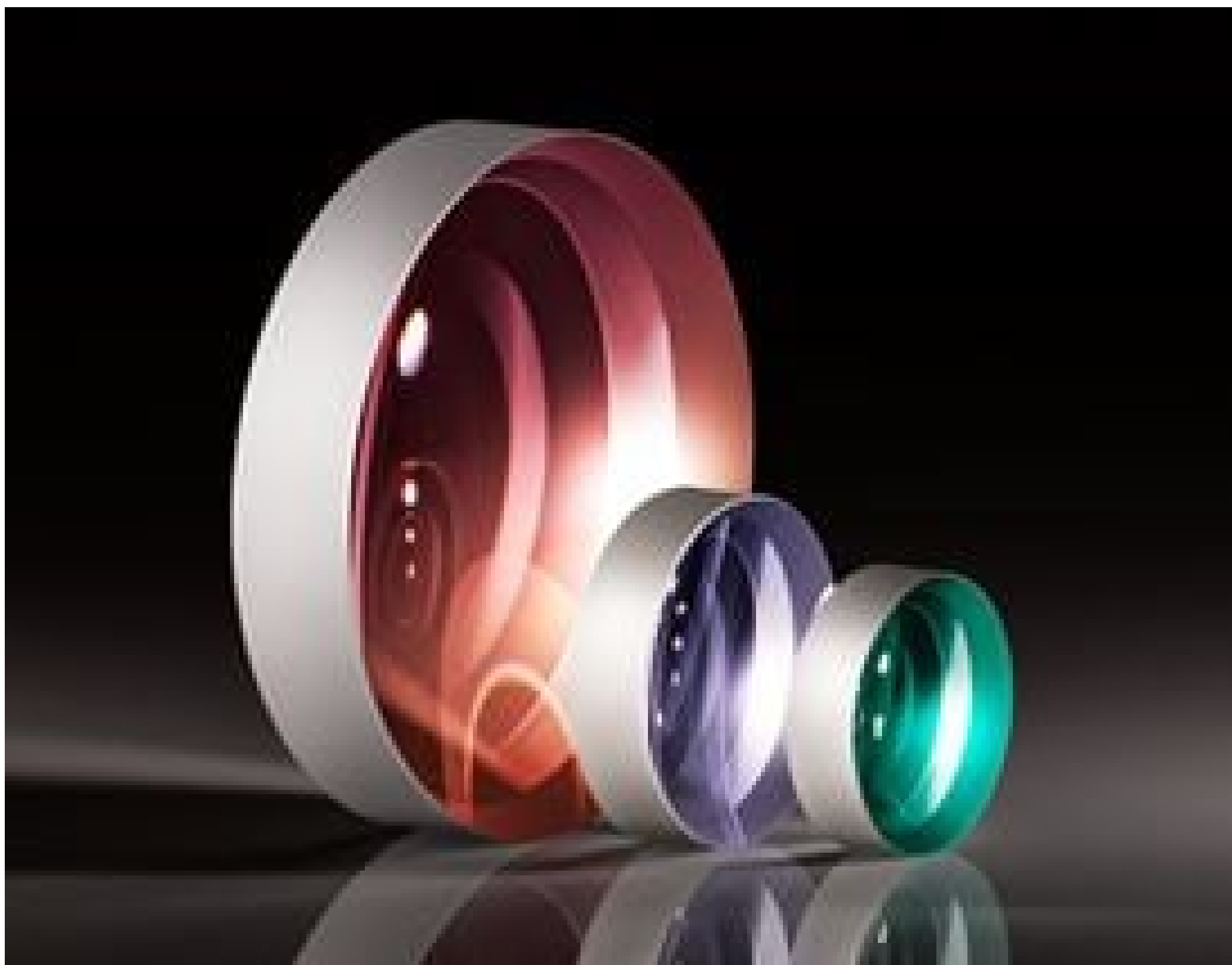
TECHSPEC Uncoated Plano-Concave (PCV) Lenses