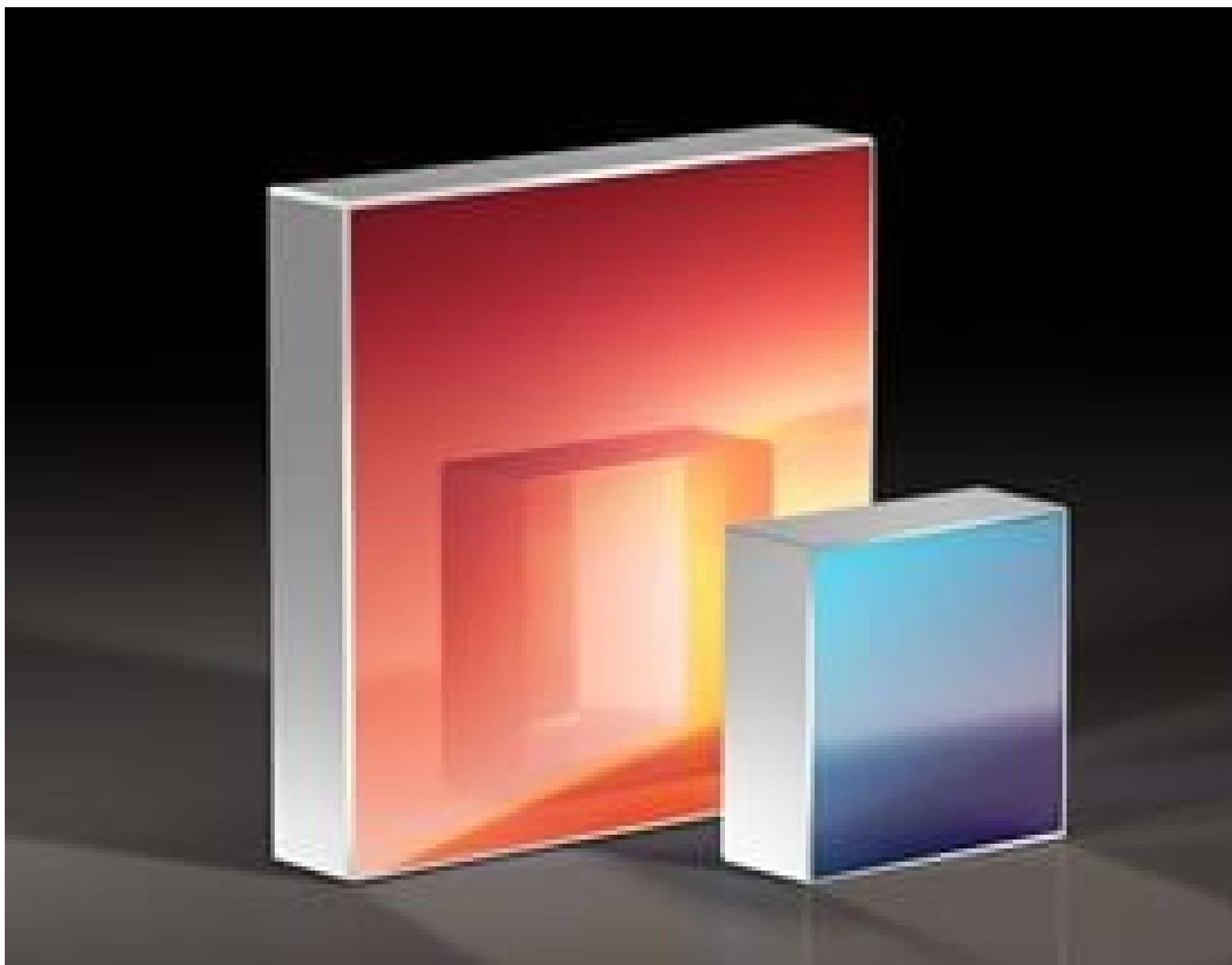
Reflective Holographic Gratings