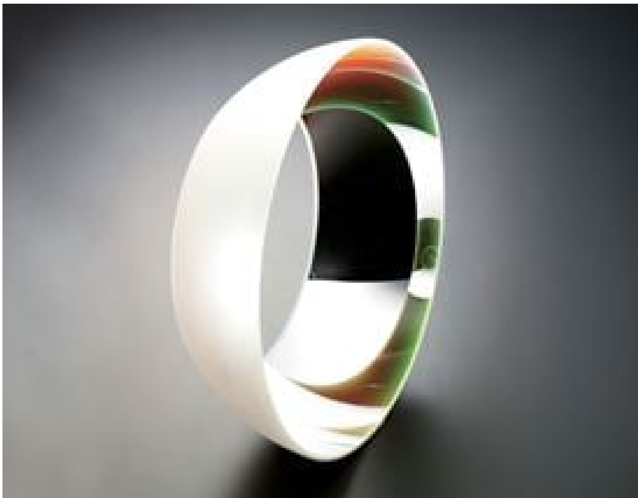
Precision Ellipsoidal Reflectors