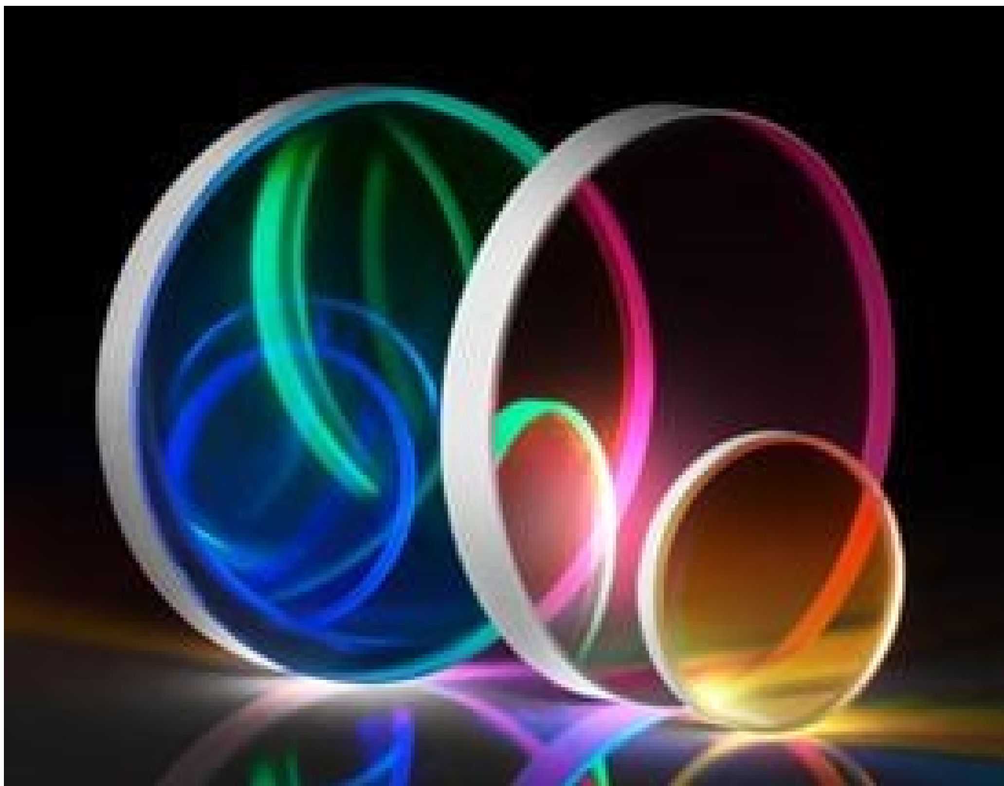
TECHSPEC OD 2.0 Shortpass Filters