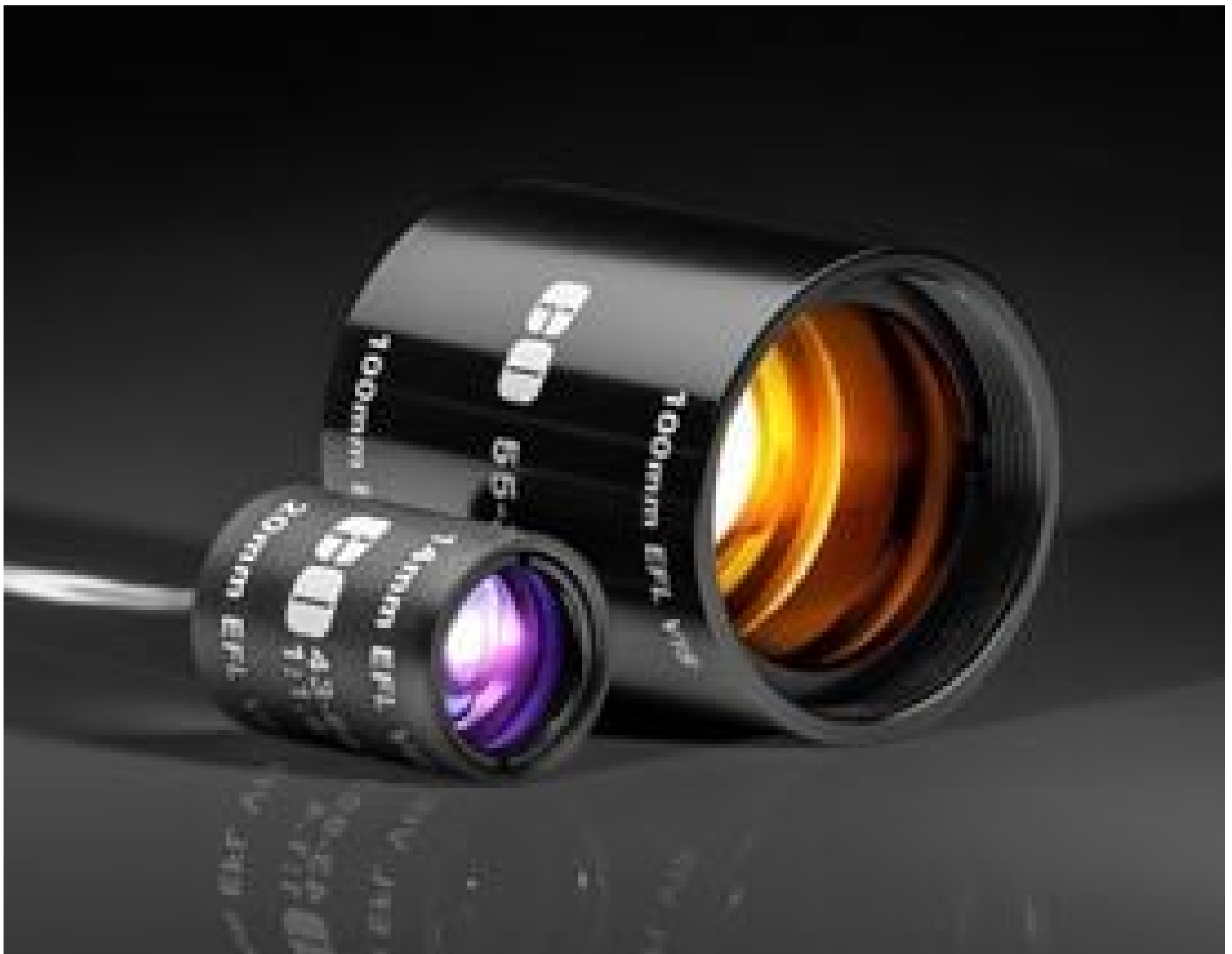
TECHSPEC Mounted Achromatic Lens Pairs