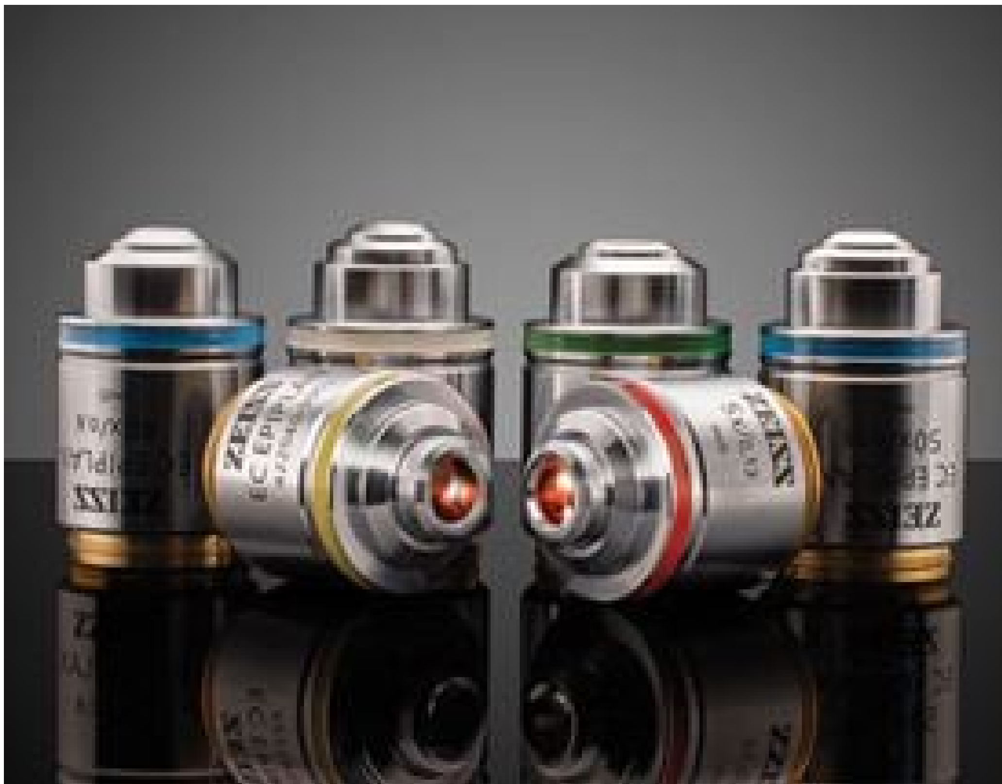
ZEISS EC Epiplan Objectives