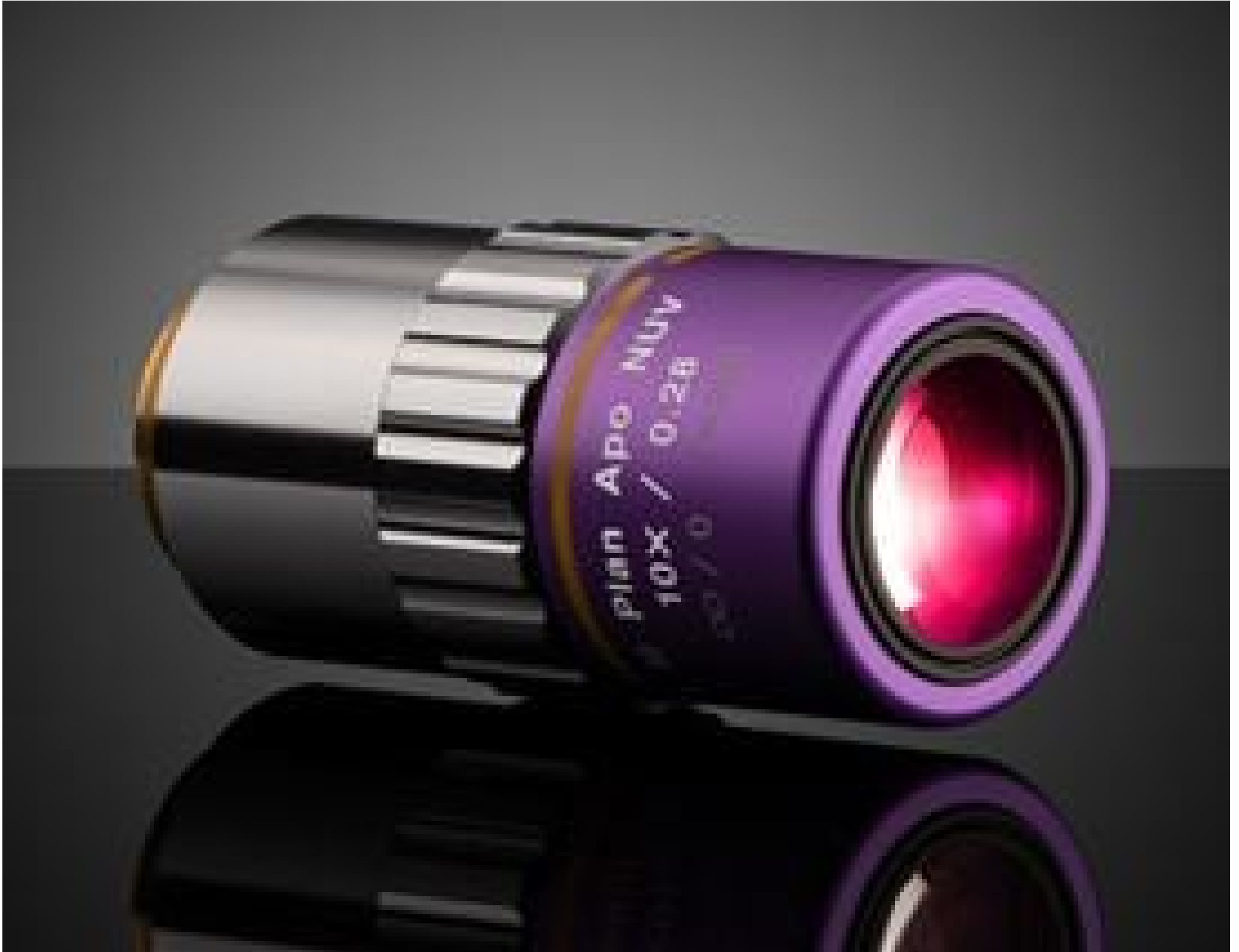
10X Mitutoyo Plan Apo NUV Infinity Corrected Objective, #86-176