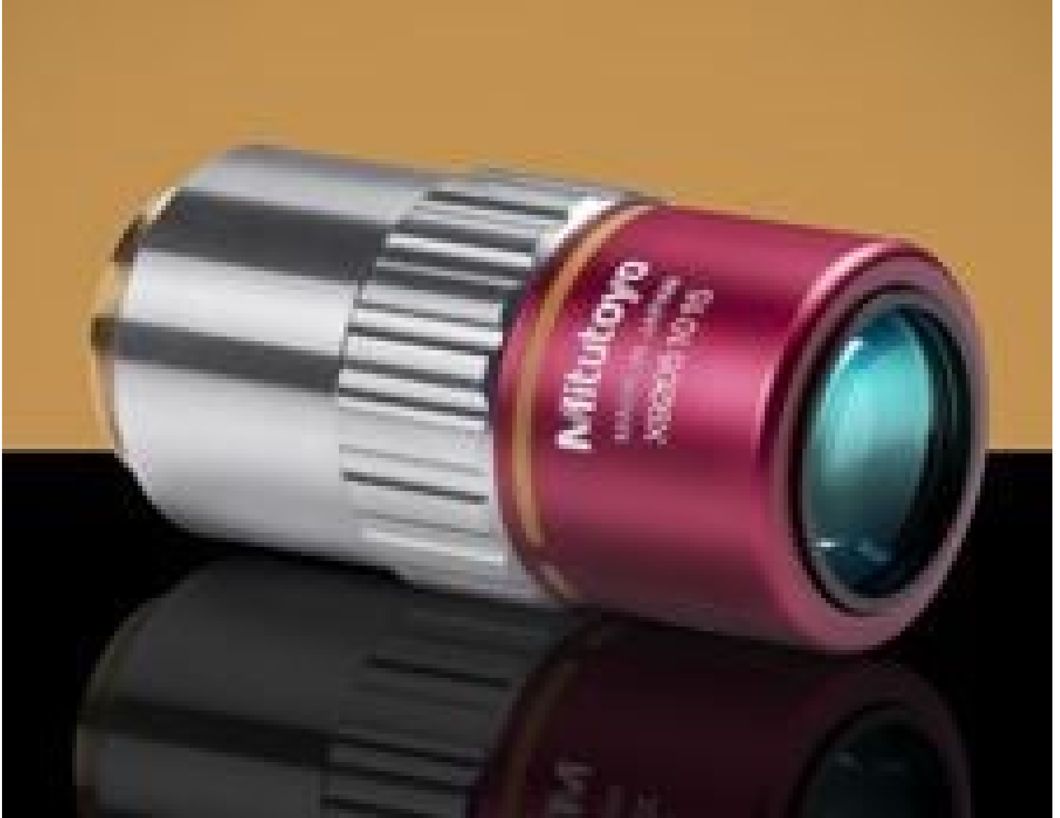
10X Mitutoyo Plan Apo NIR Infinity Corrected Objective, #46-403