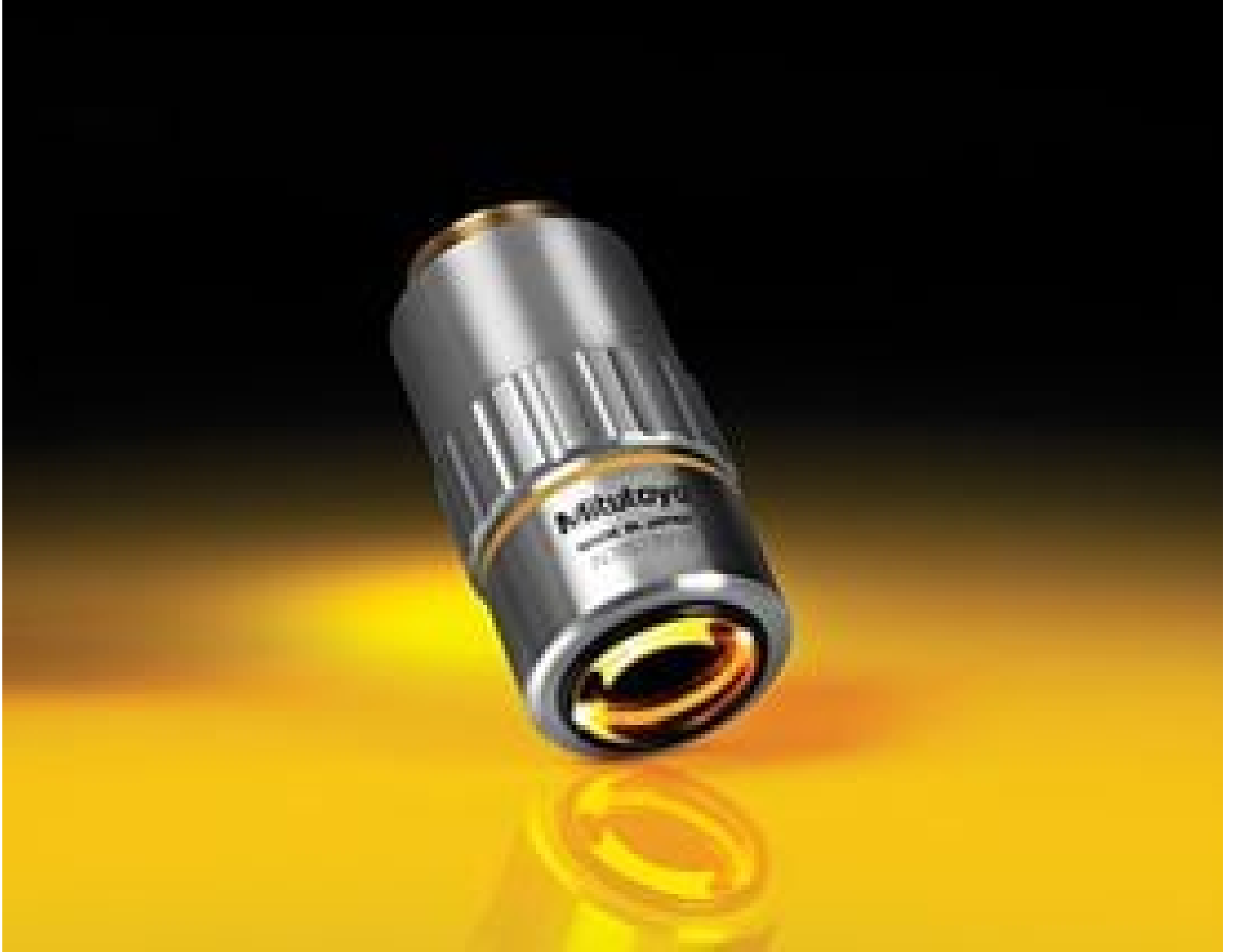
10X Mitutoyo Plan Apo Infinity Corrected Long WD Objective, #46-144