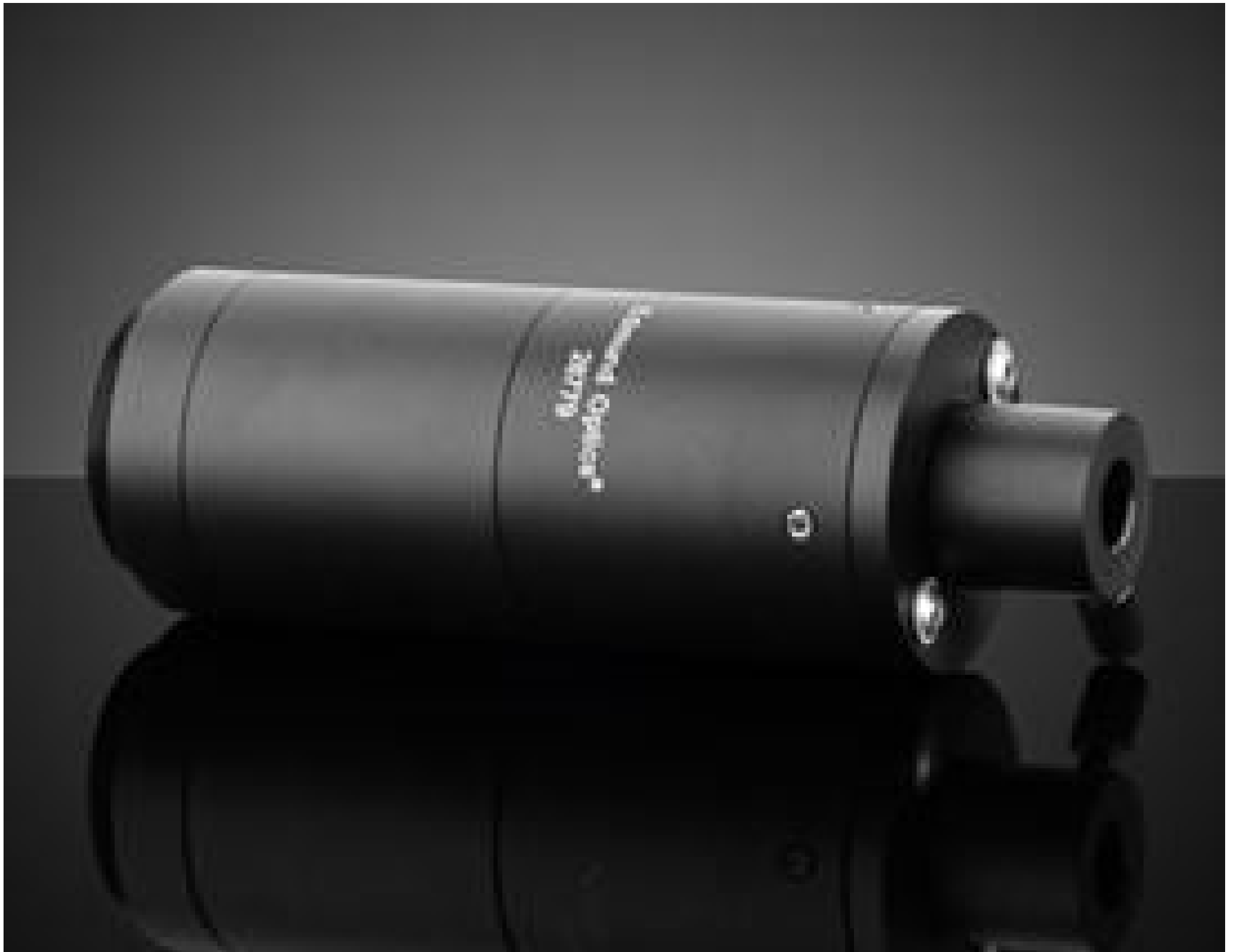
10X Focusing Lens