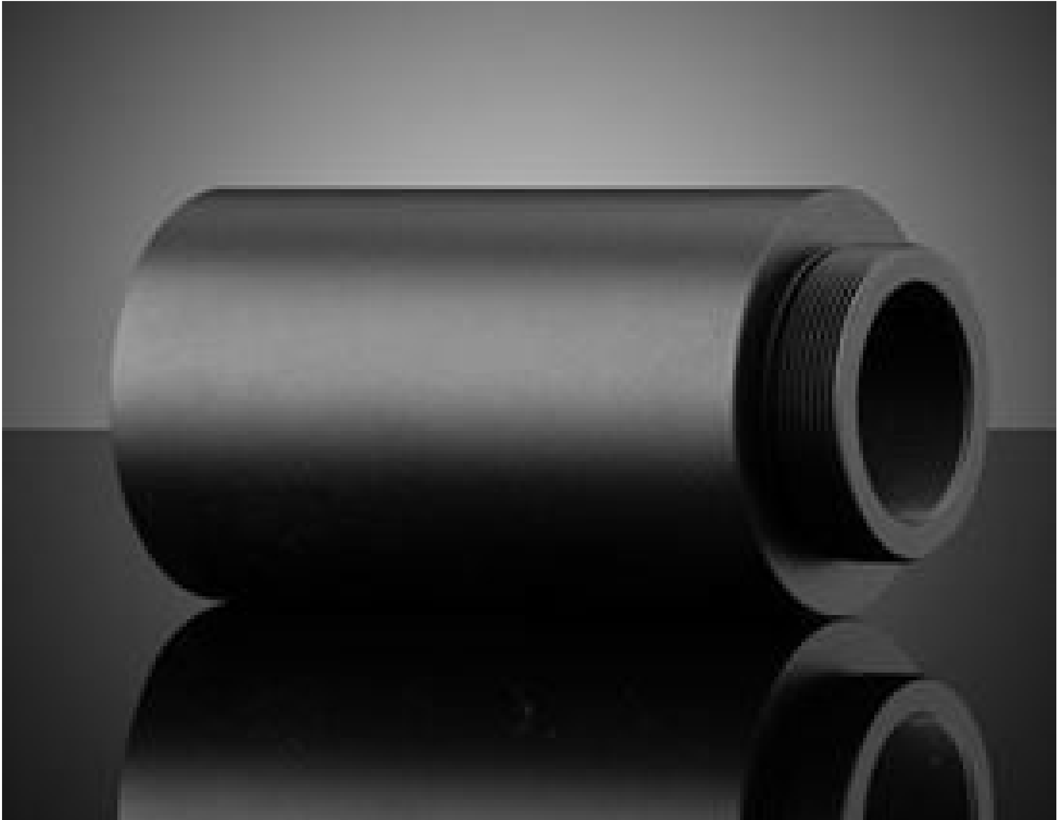
#24-218: 5X, 95mm M26 Parfocal Adapter