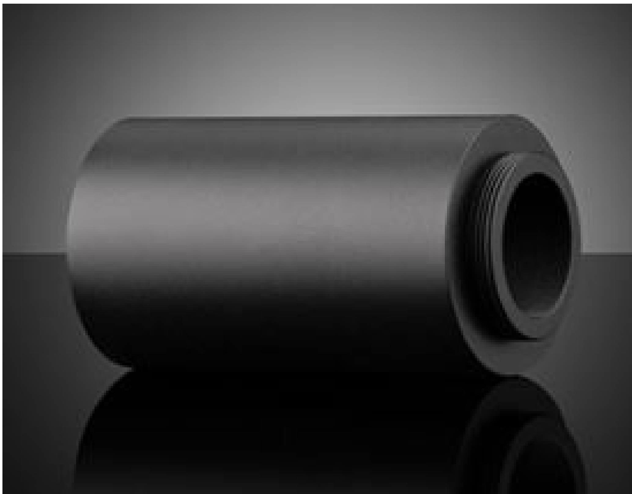
#23-901, 5X, 95mm, C-Mount Parfocal Adapter