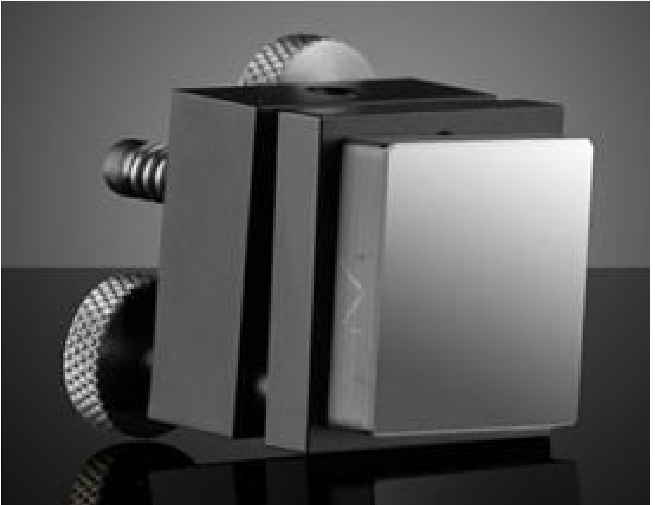
Mirror Mount with Mirror