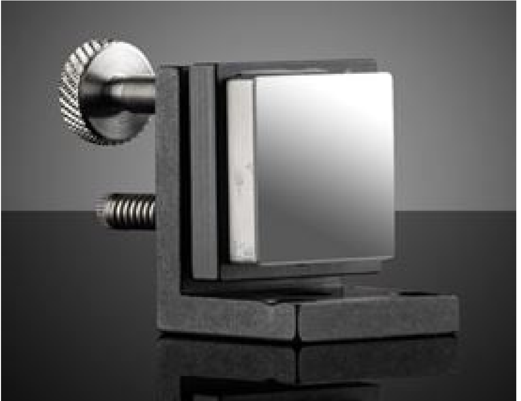
1.0" Angle Mirror Mount with Mirror