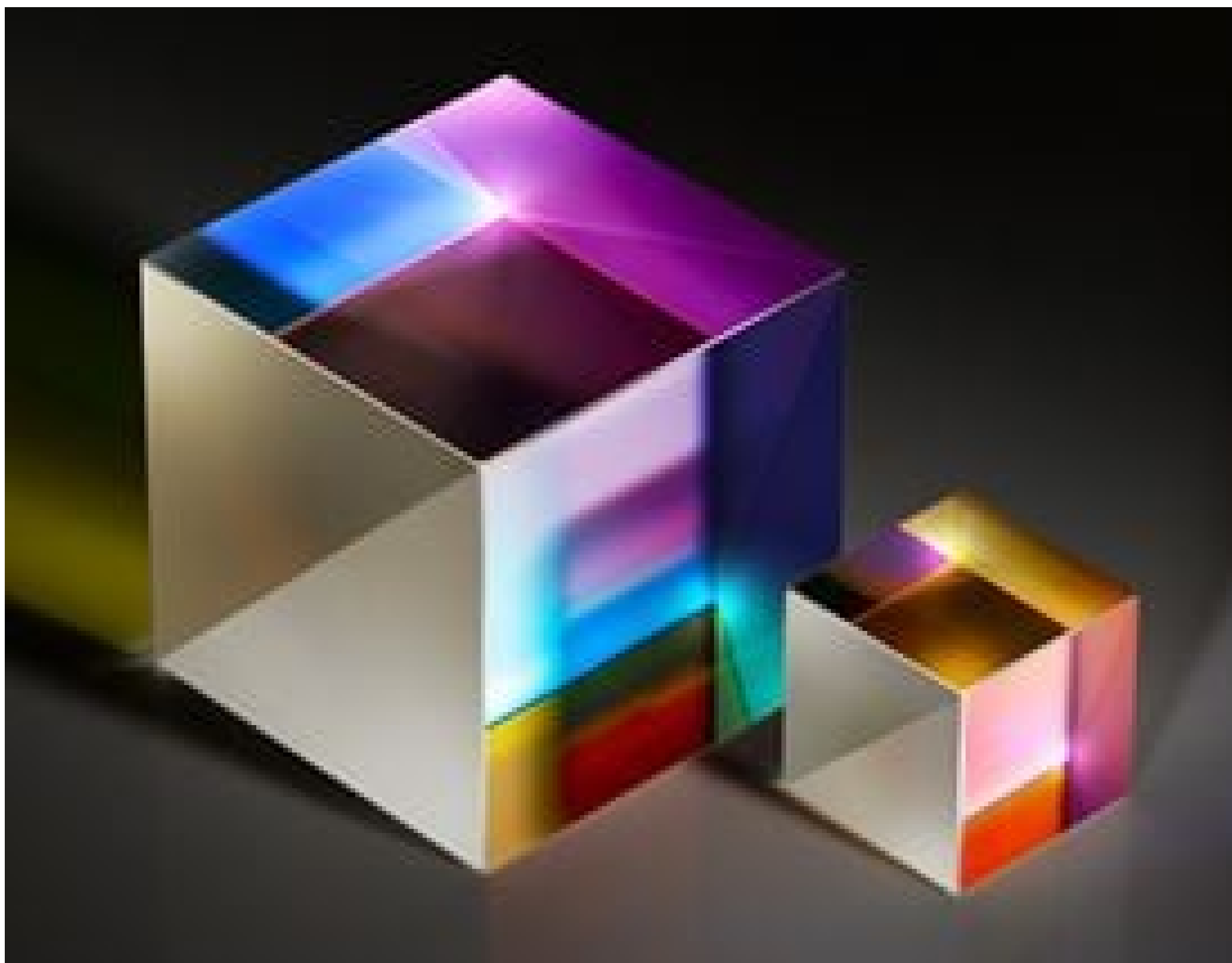
TECHSPEC® Broadband Polarizing Cube Beamsplitters