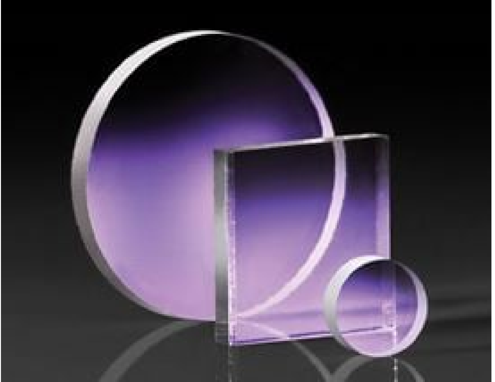
TECHSPEC BOROFLOAT Borosilicate Windows