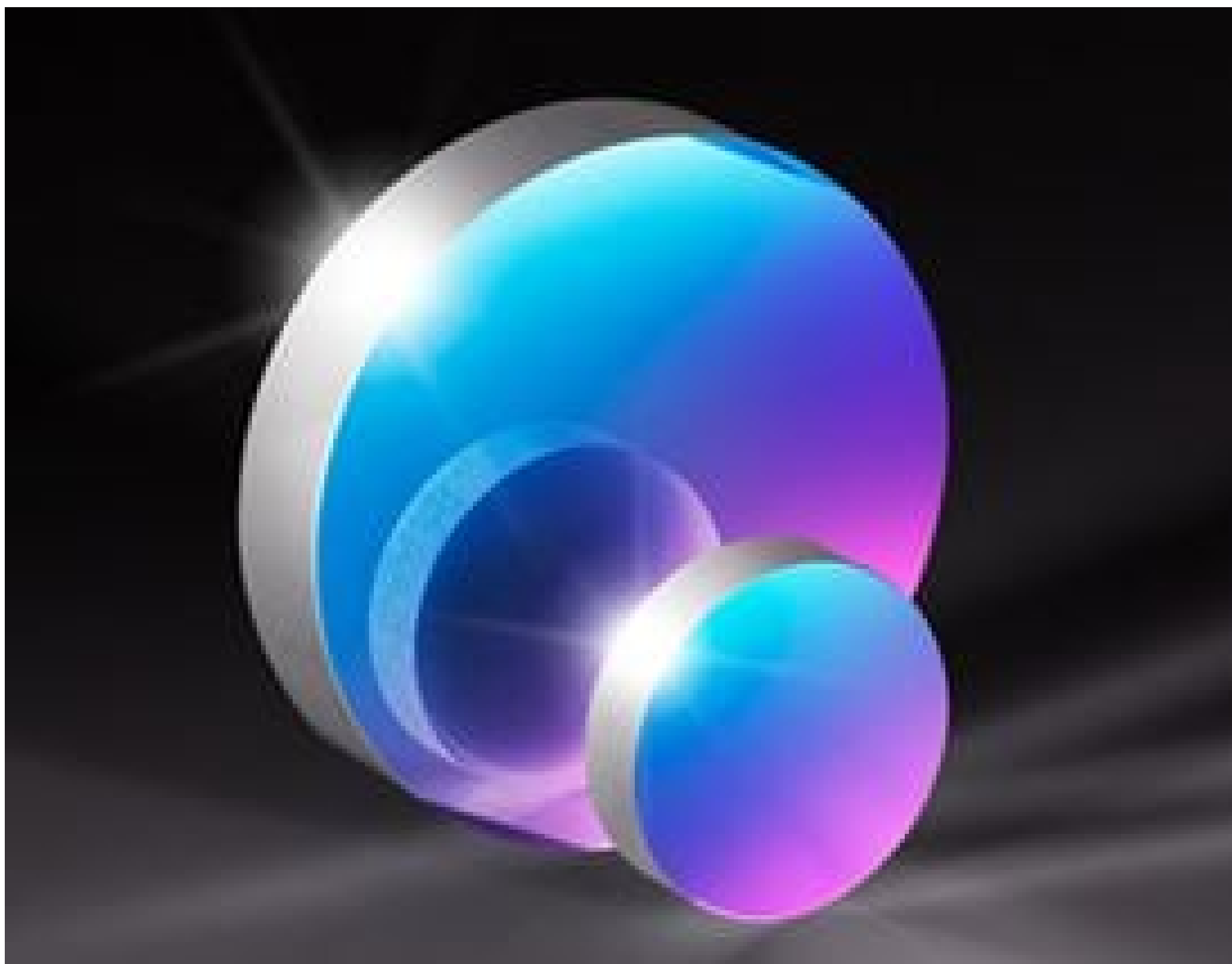
Precision Ultraviolet Mirrors