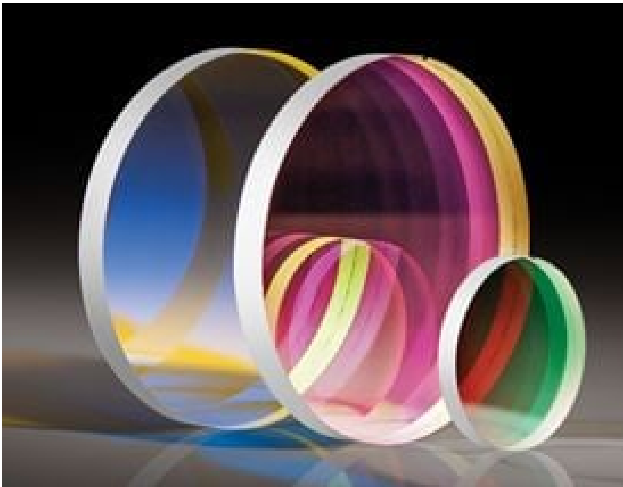
High Performance OD 4.0 Longpass Filters