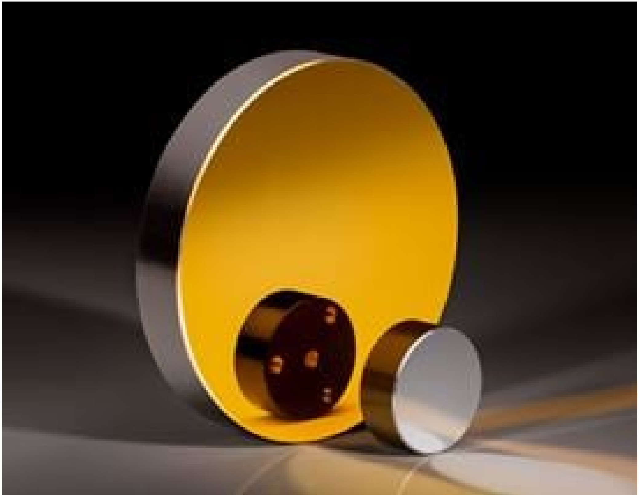
Metal Substrate Mirrors