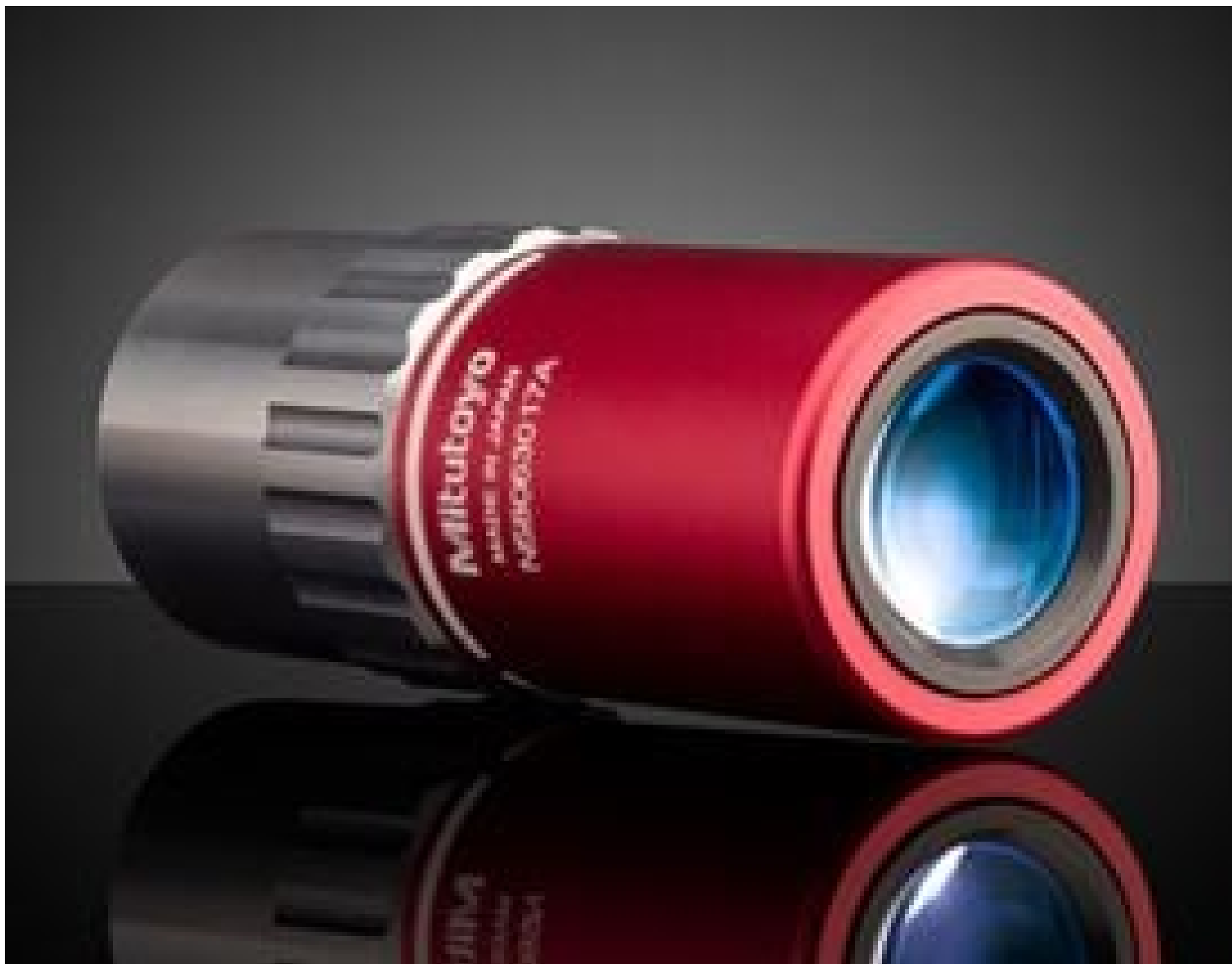
100X Mitutoyo Plan Apo NIR Infinity Corrected Objective, #46-406