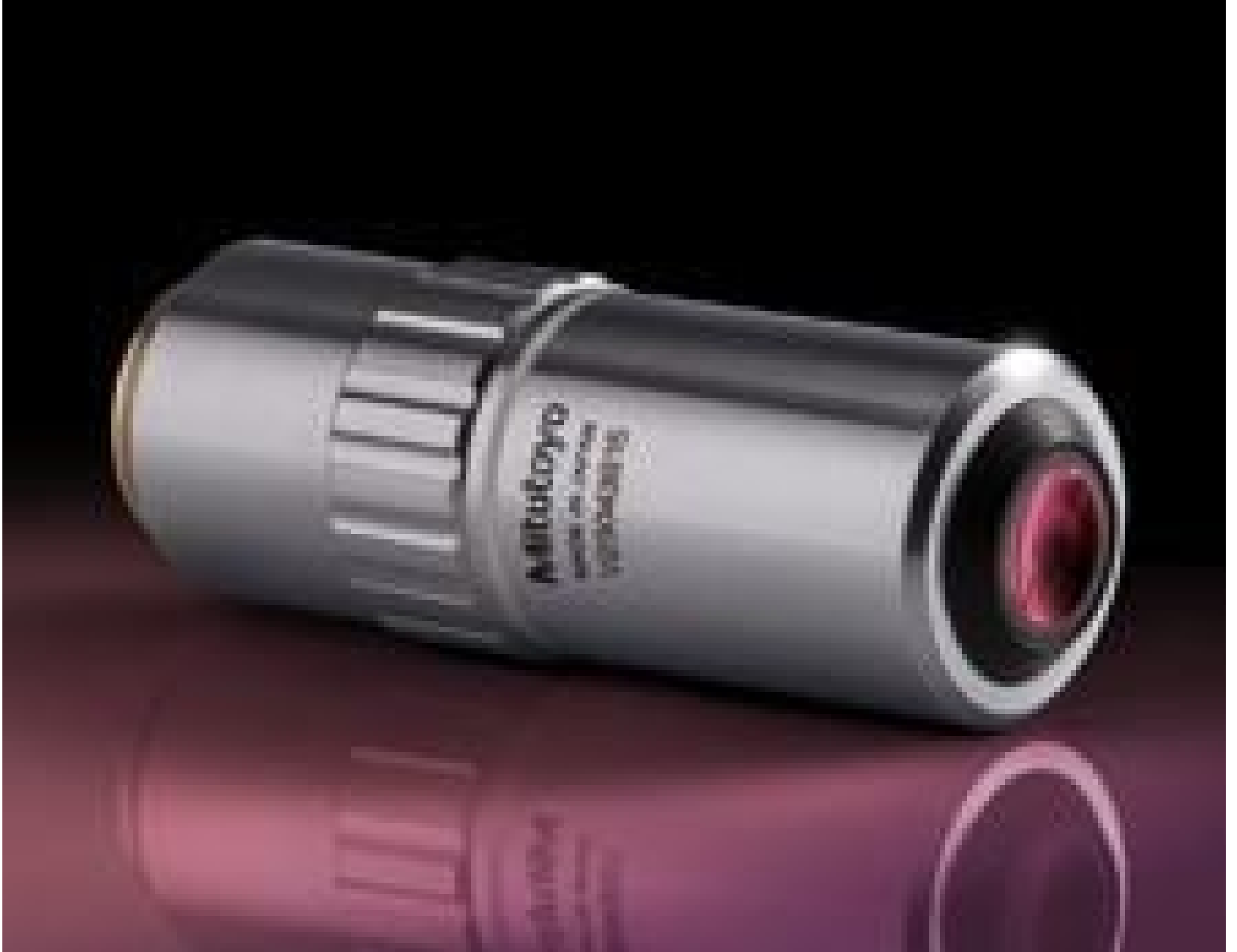
100X Mitutoyo Plan Apo Infinity Corrected Long WD Objective, #46-147