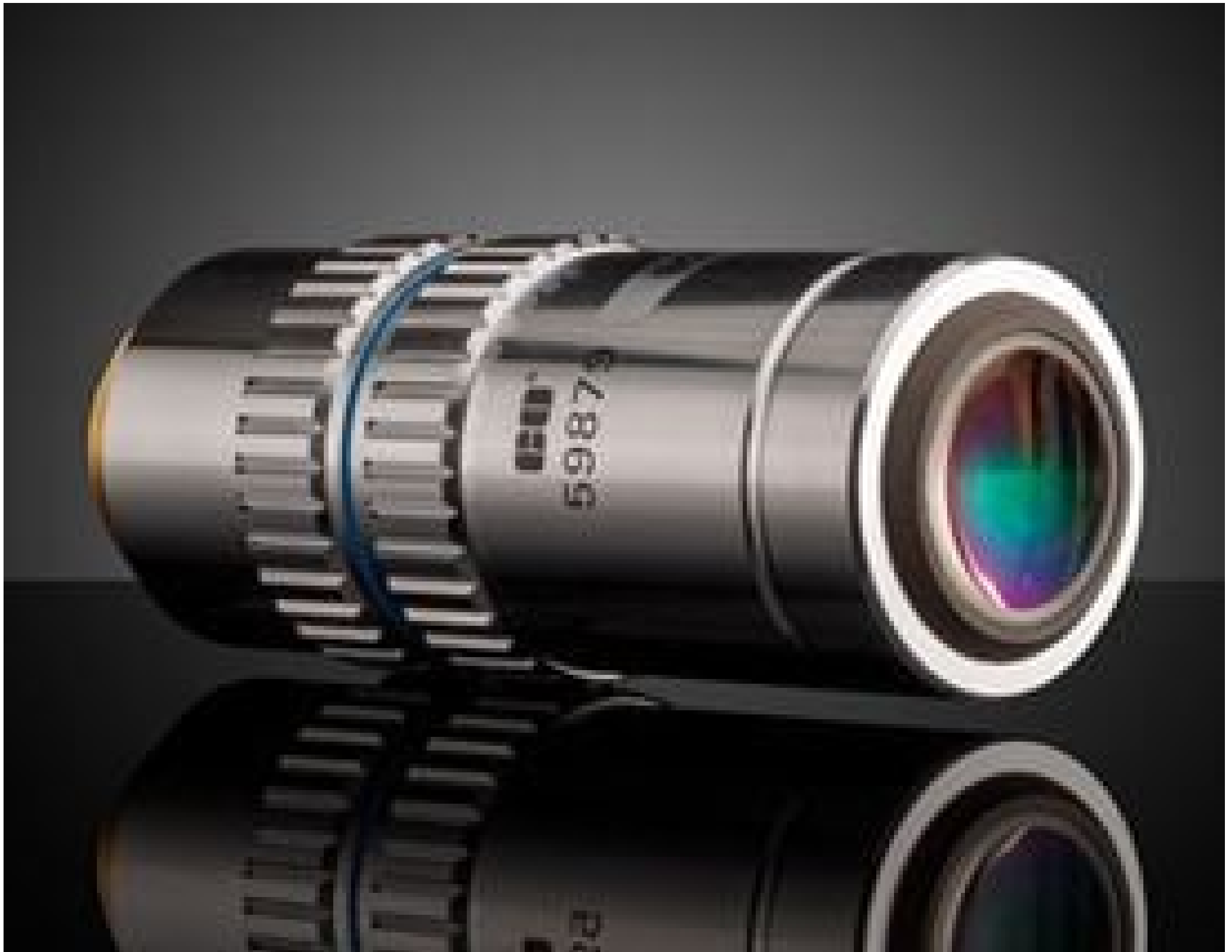
50XEOMPlan Apo Long Working Distance Infinity Corrected, #59-879