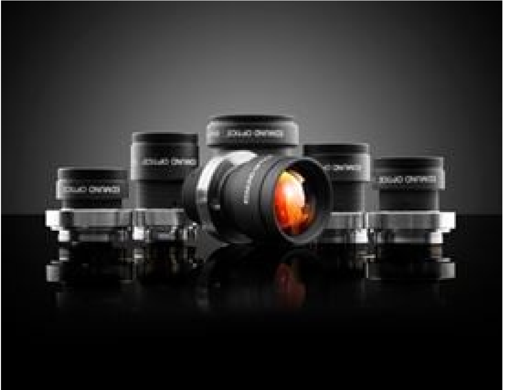
TECHSPEC® Cr Series Fixed Focal Length Lenses