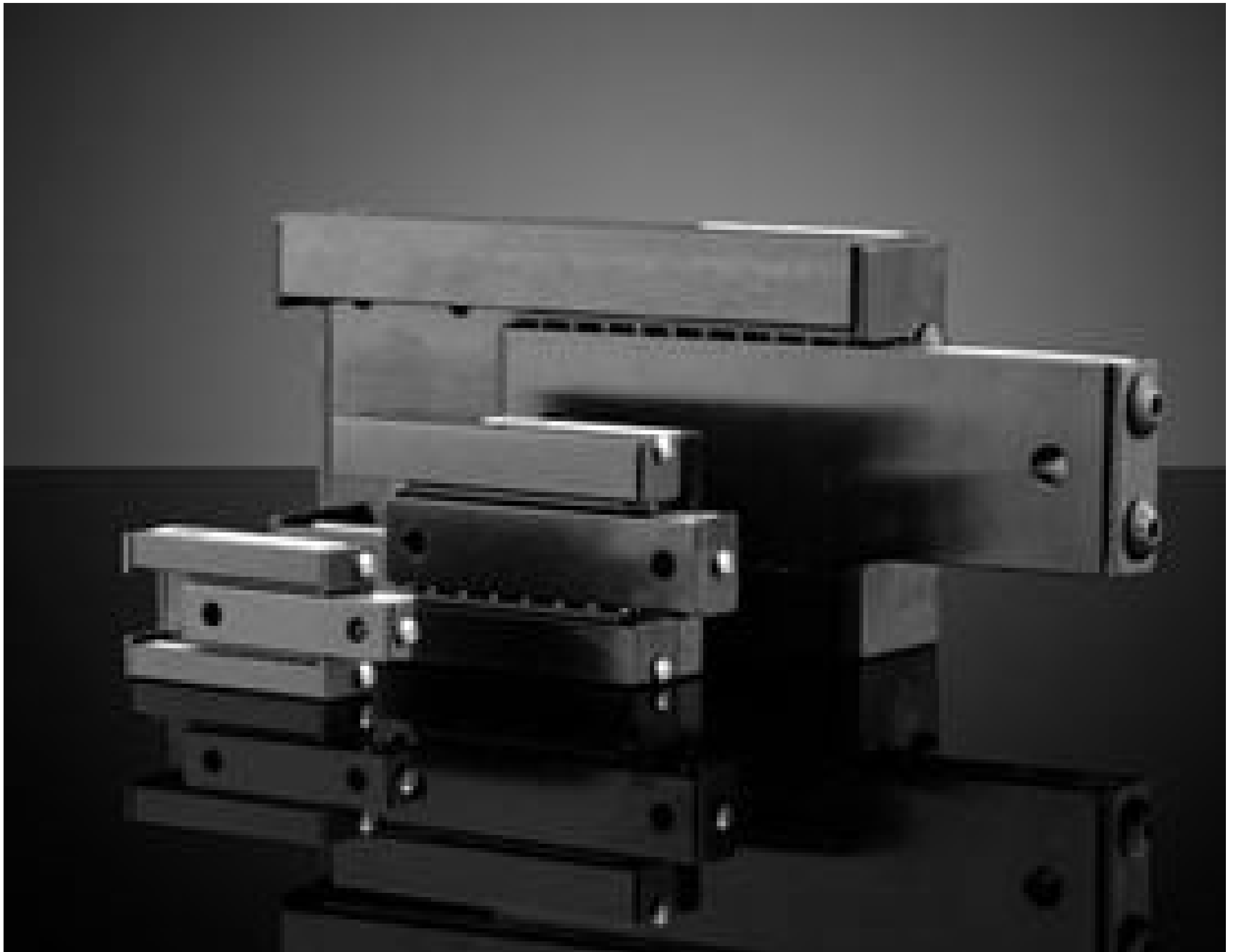
Linear Motion Ball Bearing Slides