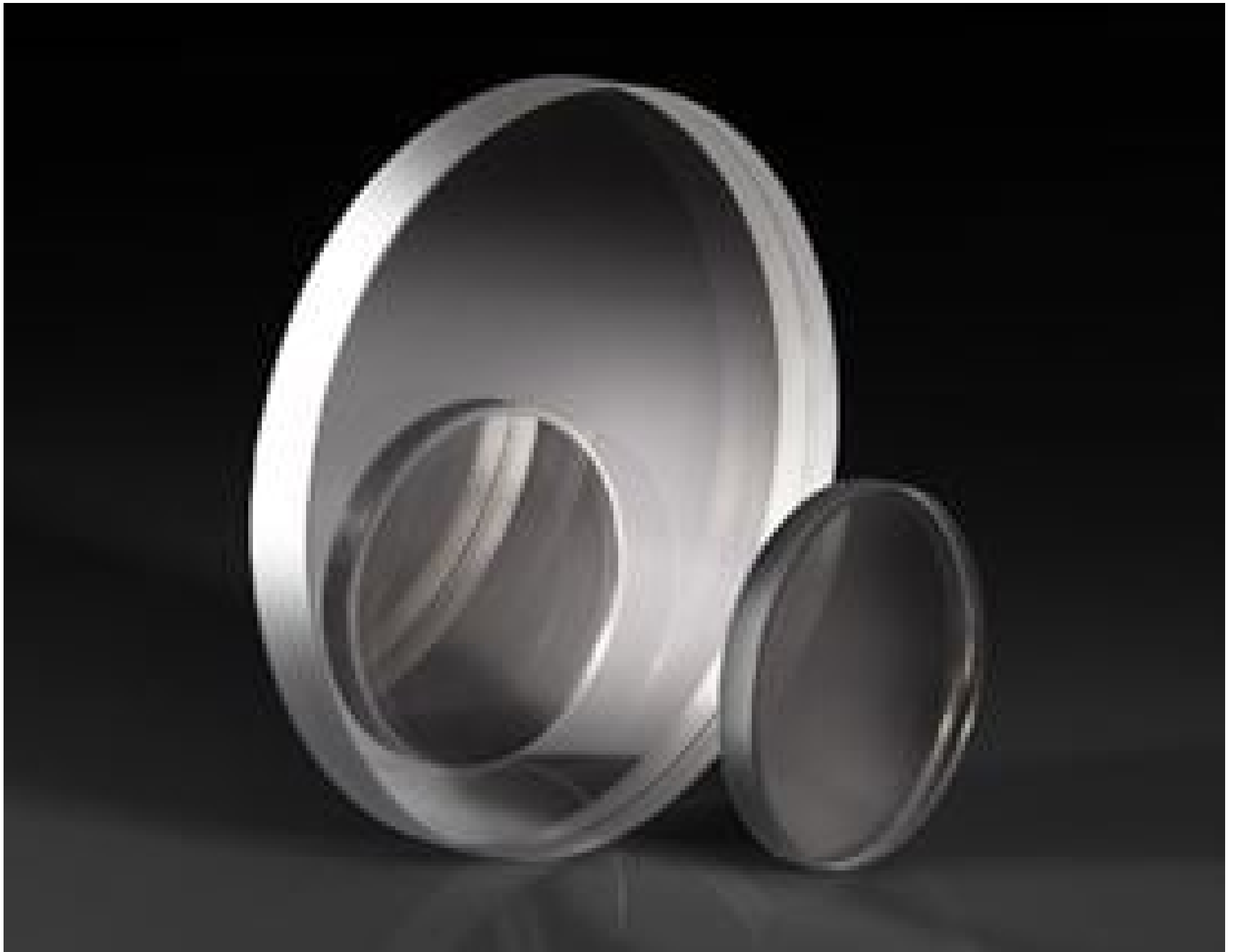
UV-NIR Neutral Density Filters