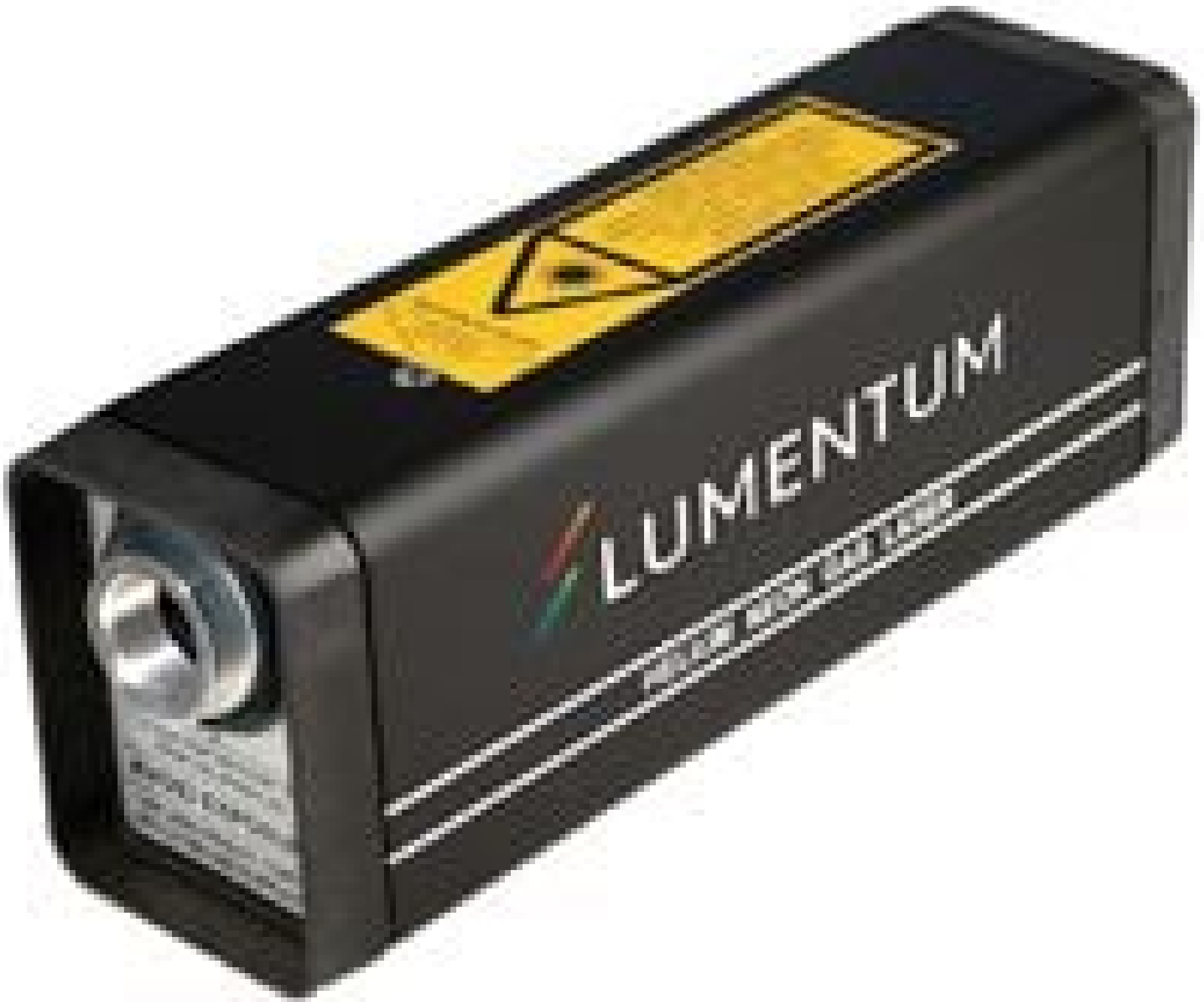
Low-Noise Lumentum Helium-Neon Laser with self-contained power supply