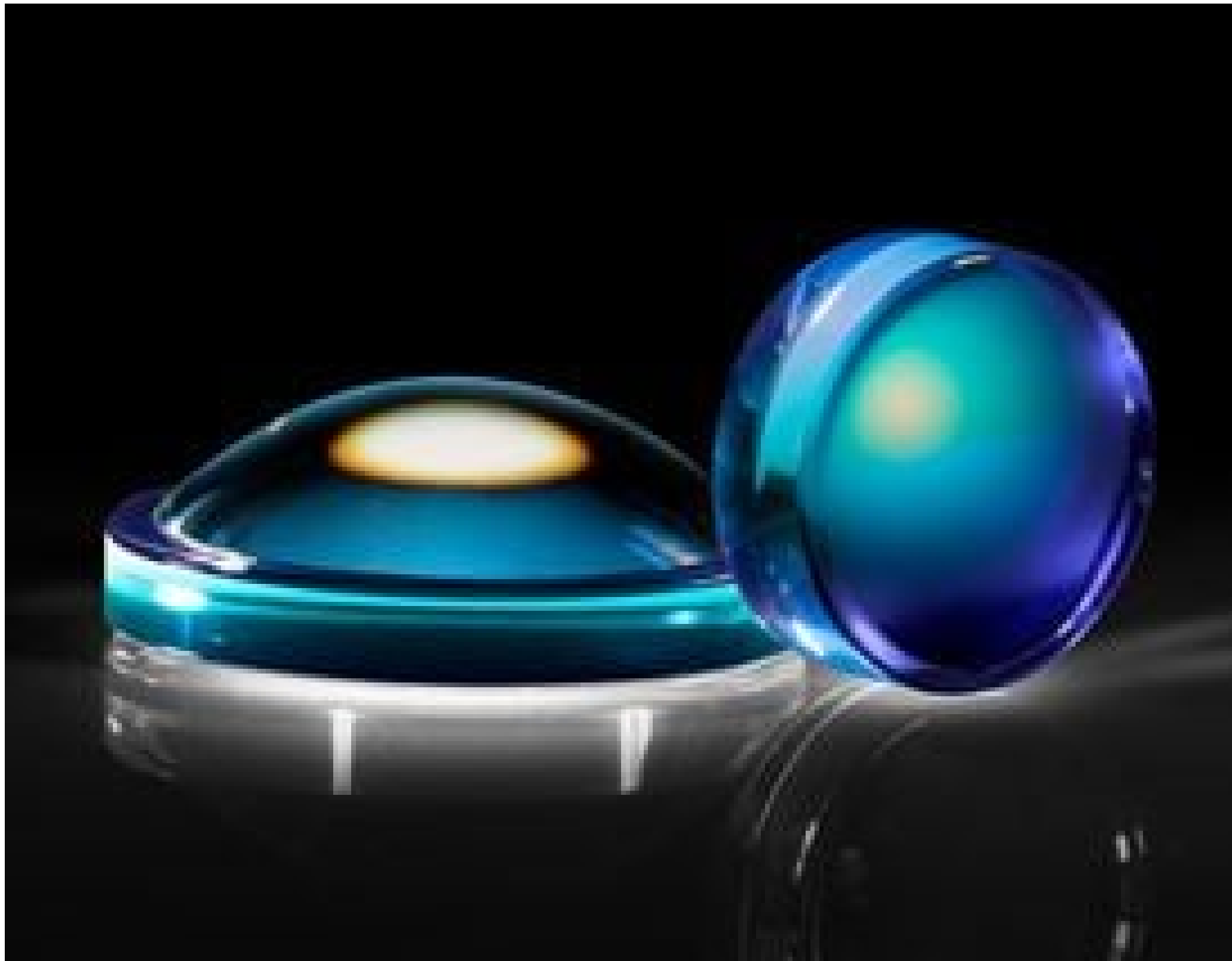
Precision Molded Aspheric Lenses