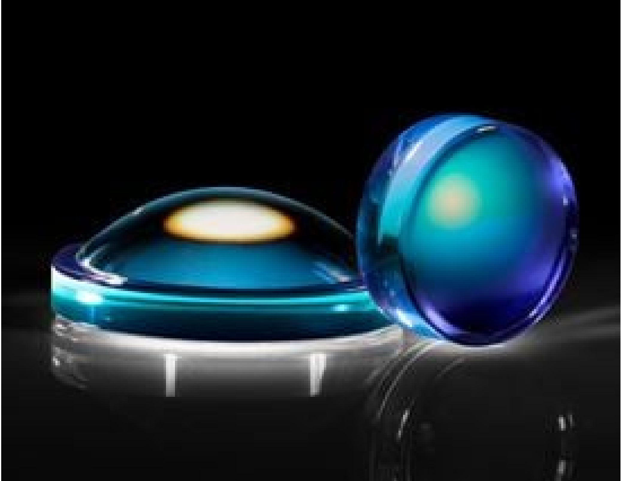
Precision Molded Aspheric Lenses