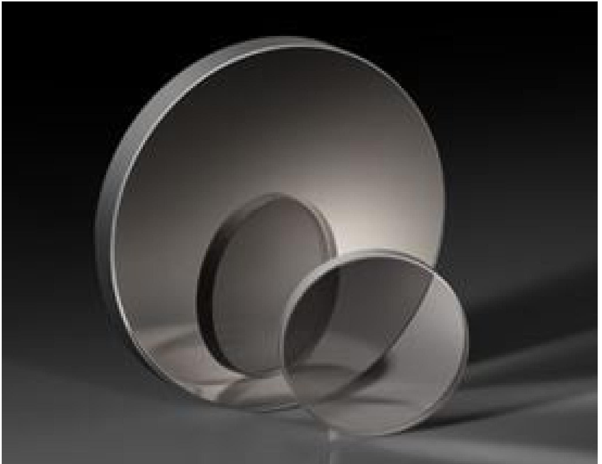
Near-IR (NIR) Neutral Density (ND) Filters