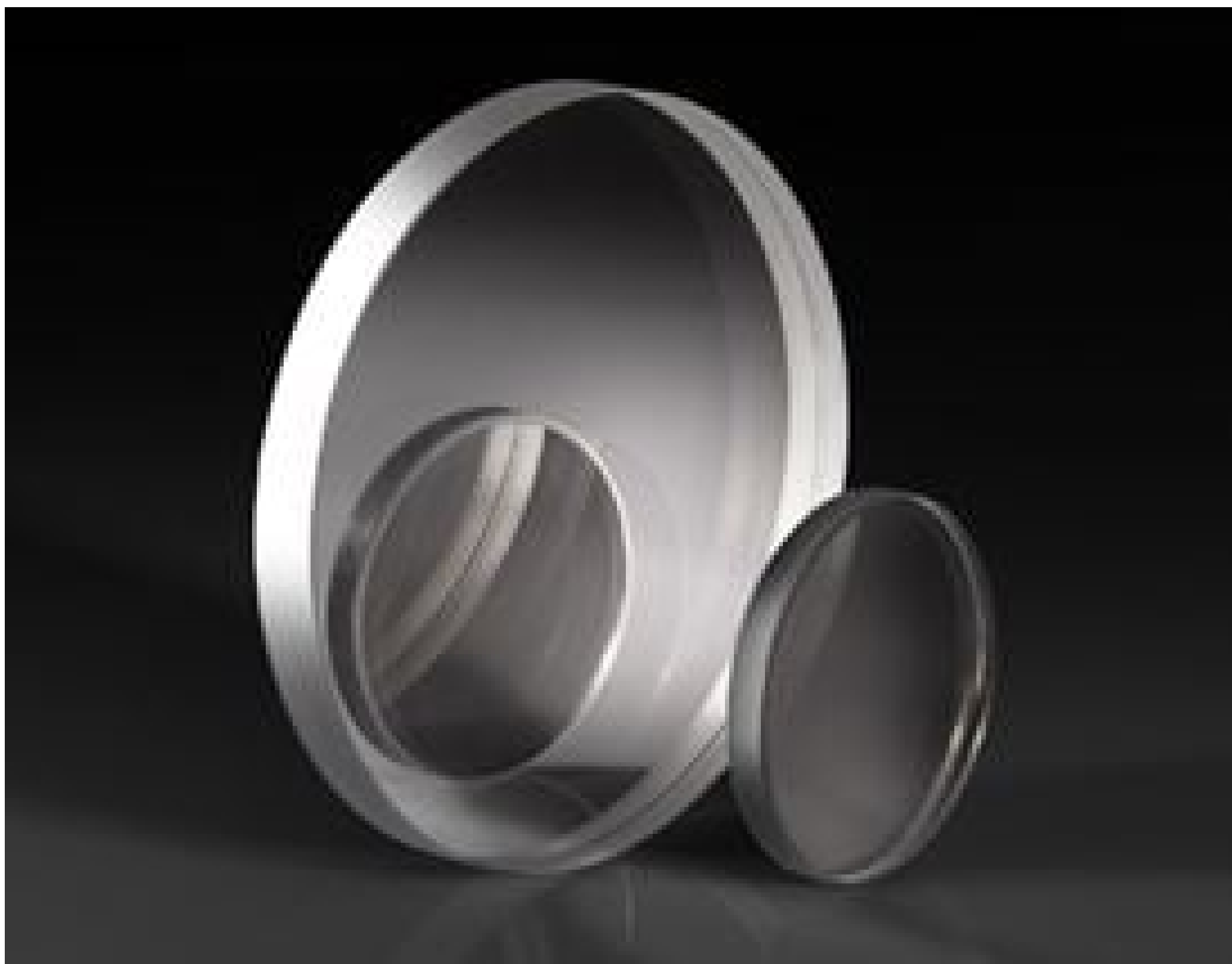
UV-NIR Neutral Density Filters