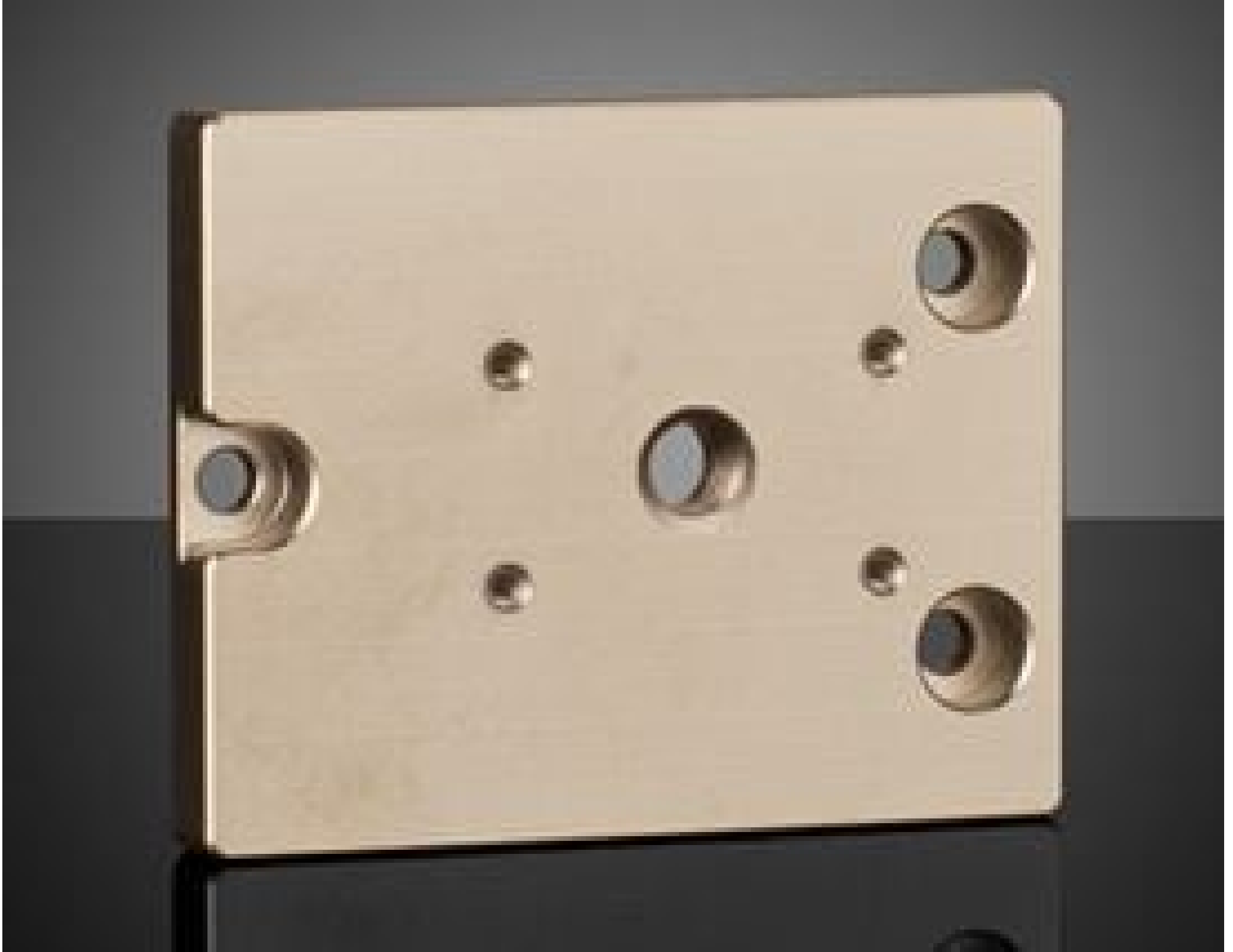
1/4-20 Mounting Adapter for Basler ace L GigE