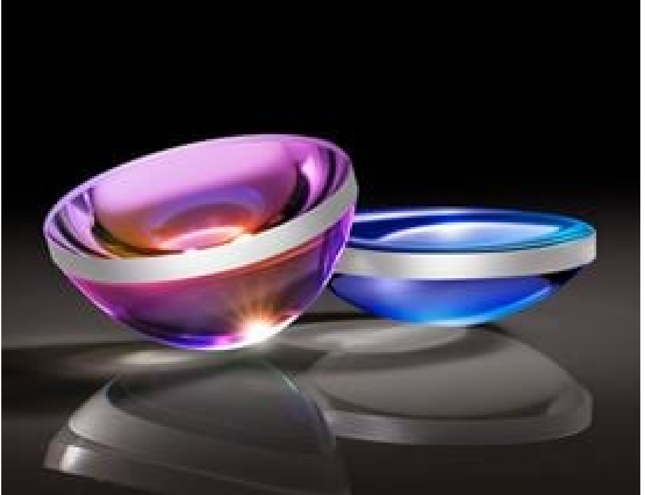
TECHSPEC UV Fused Silica Aspheric Lenses