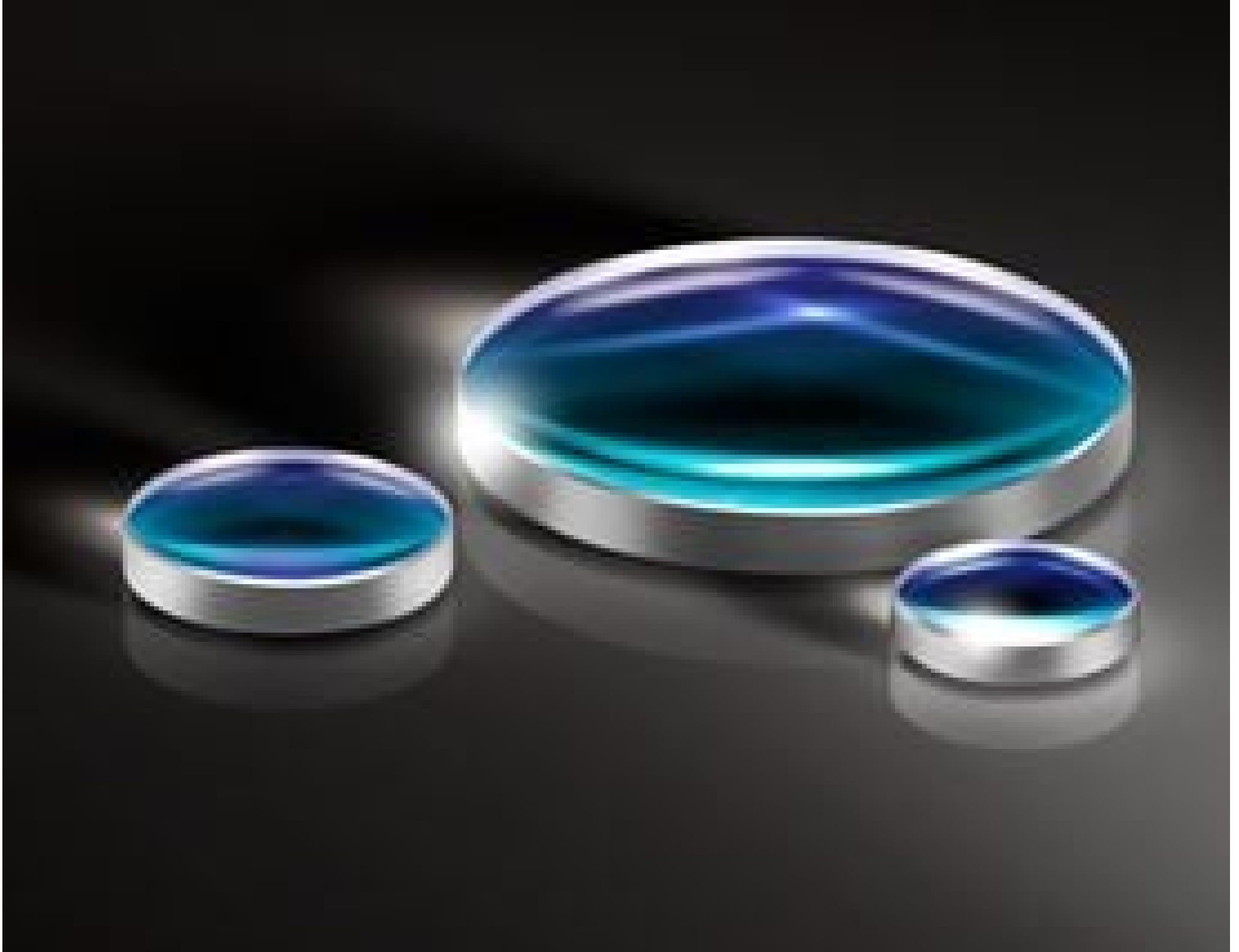
UV Fused Silica Double-Convex (DCX) Lenses